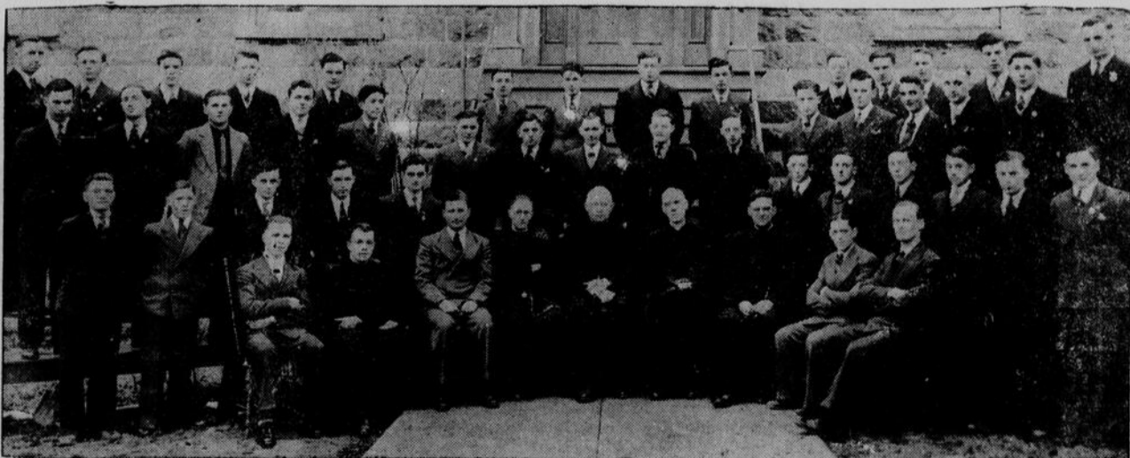
Groupe des professeurs et des élèves pour l'année 1940 - 41. Cette école aura bientôt complété une nouvelle organisation qui s'emploiera à entraîner de jeunes artisans dans le travail du bois, durant la saison de l'été, c'est-à-dire, pendant une période de 6 mois.

Le service de l'aide à la Jeunesse et les autorités de l'Ecole s'emploient à cette organisation.