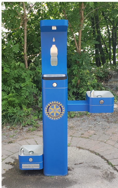
Une première à Sherbrooke: un abreuvoir pour animaux intégré à une fontaine d'eau publique.

Conçue et désignée par Mme Maryse Garand, cette œuvre a été réalisée par l'artiste sculpteure Pascale Archambault. Nous vous invitons à venir admirer ce magnifique monument érigé sur la promenade du Lac-des-Nations, rue de l'Esplanade (entre les rues de la Glacière et Vanier).