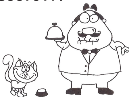
Dessin par Kelly Richter, 12 ans

« Donner sa langue au chat » signifie renoncer à deviner ou à trouver une solution à un problème. Mais d'où cette expression tire-t-elle son origine?