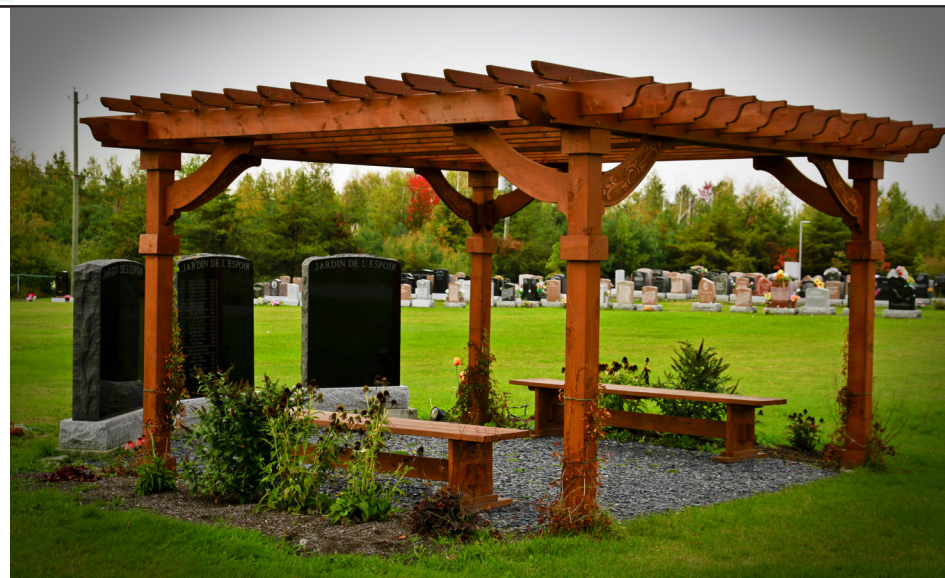
Le Jardin de l'Espoir du cimetière de la Coopérative funéraire de l'Estrie de la rue du 24-Juin à Sherbrooke

Notre cimetière dévoile un groupe de jardins thématiques qui viennent offrir un environnement susceptible de s'adapter à la personnalité du défunt. Le Jardin Naturel offre un lieu de sépulture à même une forêt urbaine dont le sol est jonché de fougères luxuriantes. Tout près, le Jardin des Générations permet la plantation d'arbustes au moment de la mise en terre de l'urne. Quant au