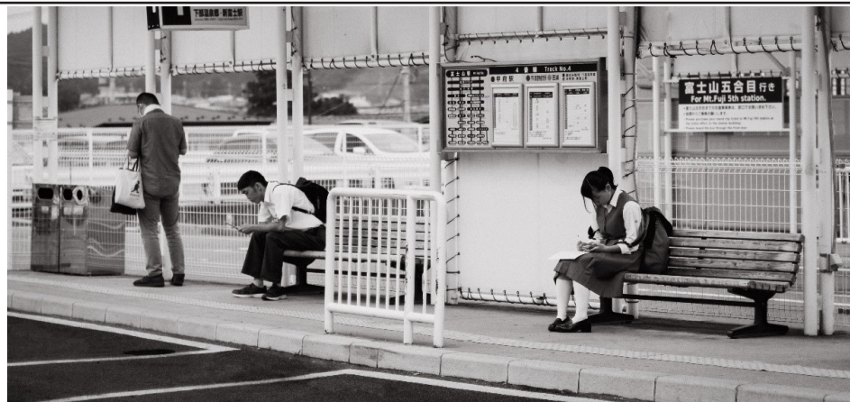
Et si Facebook était plutôt un réseau « anti » social?

Faire partie de cette communauté, c'est consentir à l'utilisation qui est faite de vos données, soit le développement de technologies avancées telles que l'intelligence artificielle, les systèmes d'apprentissage automatique, la reconnaissance faciale et la réalité augmentée. Tout cela dans un objectif de monopole, de pouvoir et de profit. De plus, Facebook partage les données avec ses très nombreux partenaires comme des annonceurs, des entreprises, les forces de l'ordre ou des chercheuses et chercheurs universitaires en vue d'effectuer des recherches, par exemple, sur les comportements humains afin de prévoir ou même d'orienter des réactions de masse. Ensemble, ils communiquent des informations concernant vos activités en dehors de Facebook, que vous possédiez ou