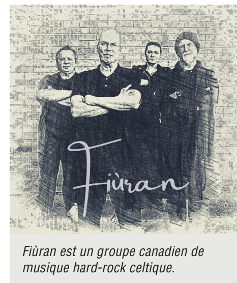
Fiùran est un groupe canadien de musique hard-rock celtique.