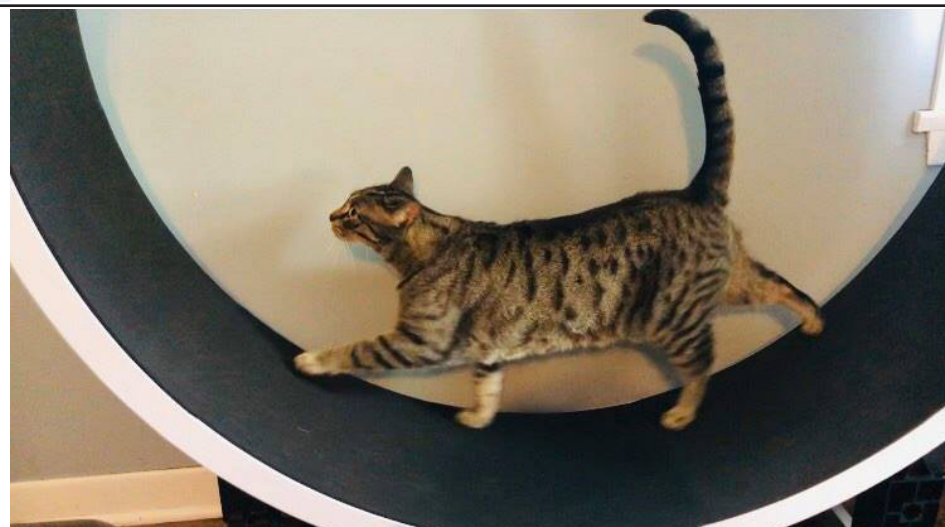
L'exercice physique favorise la perte de poids.

L'obésité de nos animaux va bien au-delà du fait d'être dodus, car cela entraîne une quantité considérable de problèmes de santé : difficultés respiratoires, maladies cardiaques et hypertension artérielle, diabète sucré, diminution du fonctionnement du foie, problèmes de peau et de pelage. En effet, un chat devenu incapable de se toiletter dû à son embonpoint aura des pellicules, le pelage gras, une perte de poils plus conséquente et parfois même des dermatites localisées au niveau des parties génitales causées par l'accumulation d'urine ou d'excréments. Plus encore, l'obésité entraîne des problèmes articulaires, une réduction de l'endurance et de