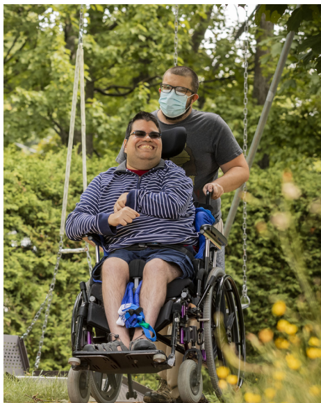
LA MAISON CAMÉLÉON DE L'ESTRIE

Devoir quitter son emploi pour apporter des soins à son enfant ou placer son conjoint en CHSLD faute d'insuffisance de personnel pour venir à domicile ne devrait jamais être une option. Pourtant, c'est la triste réalité vécue par trop de personnes handicapées et leur famille.