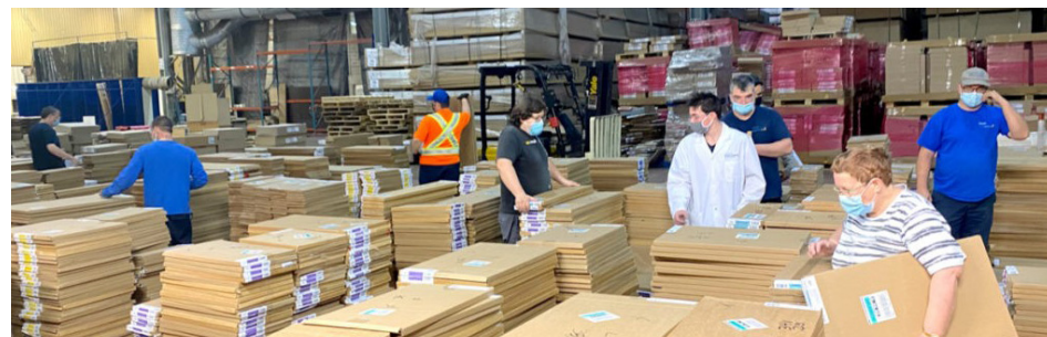
Stagiaires du groupe Probex

En plus de favoriser la participation active des personnes vivant avec