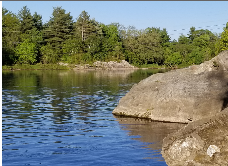
Près de l'eau...

bord de l'eau ne peut s'empêcher de regarder le reflet de son visage et d'en être ému. Il s'y voit, tant qu'il est immobile et que la surface de l'eau reste miroitante. Hypnotisé, il n'ose pas bouger, confortable dans l'admiration. J'imagine Narcisse sortir de son hébètement et entrer dans l'eau pour s'y baigner. Le mouvement de son corps immergé fragmente alors son image qui se disperse au gré des vaguelettes. Je l'imagine souriant acceptant de s'offrir aux mouvements porteurs des flots en interrompant l'attraction de son reflet. Je le vois prendre part à son environnement plutôt que de s'en servir comme un miroir.