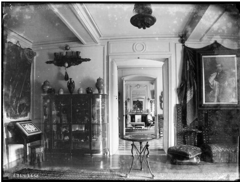
Château Le Chillon : intérieur, enfilade de pièces.