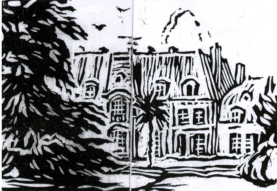
(Litho par Wilfrid Corbeil d'après nature)

Le château de Chillon ...ayant été invité à faire les offices de Noël au château du Chillon, chez Monsieur le Marquis de Dampierre.