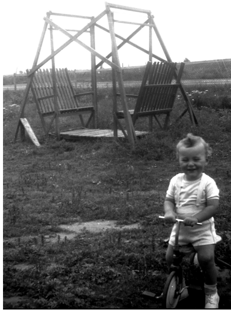
Votre humble serviteur quand il était blond !