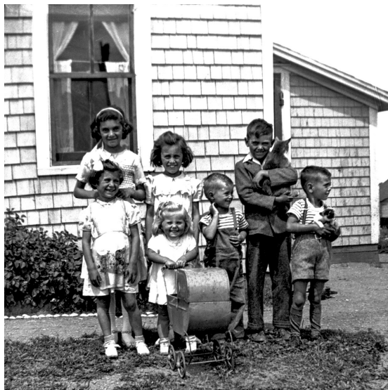
Photo de mes plus vieux frères et sœurs prises vers 1951.