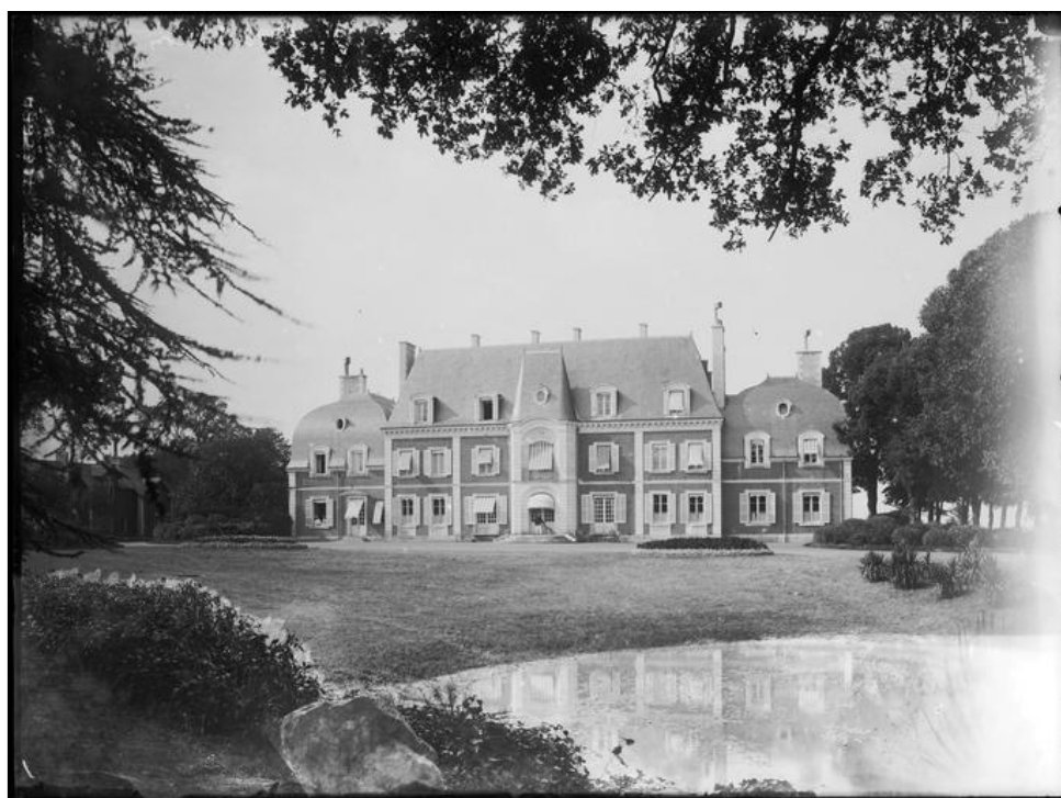
Château de Chillon Ensemble sur parc, plan d'eau au premier plan