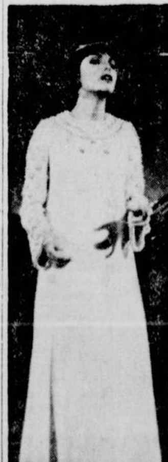
Un spectaculaire vous sera présenté à Radio-Canada le 18 septembre à 20h.00. La vedette en sera MIREILLE MATHIEU.