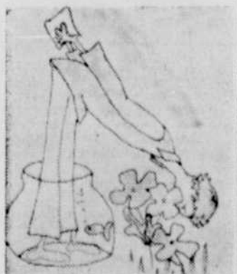
Voici la création de Diane Piché gagnante au concours carte postale Boubou.