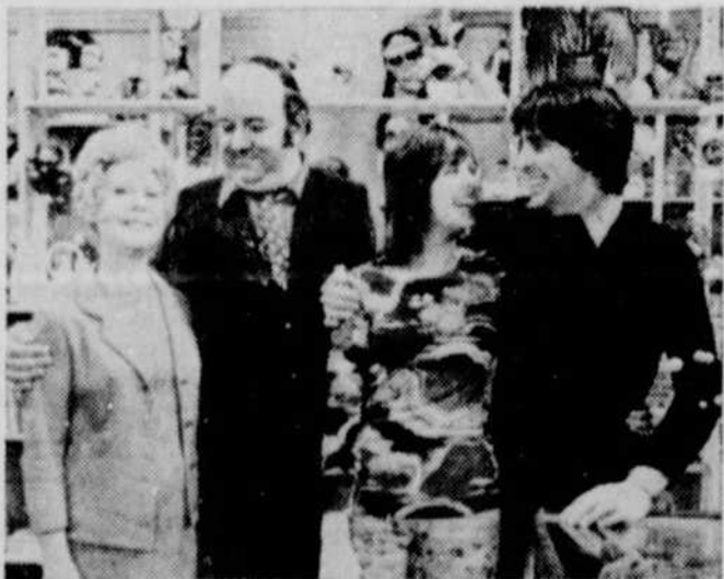
"La petite vie de petites gens, propriétaire d'un petit marché-magasin-tabagie-général dans un humbre quartier..." tel est ce que vous raconte La P'tite Semaine tous les mardis à 19h.30.