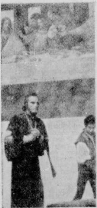
"La peinture est la poésie muette"... Léonard de Vinci. Pour mieux connaître ses oeuvres, regardez Hors-série le vendredi à 20h.30.