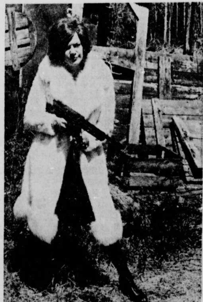
Cette semaine le cinéma PIGALLE met à l'affiche "La mort d'un bûcheron" et comme deuxième film "Les Colombes". ■

Ce film n'a pas encore été coté par l'Office des communications sociales.