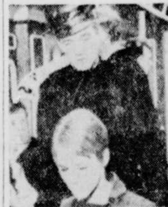
"Fahrenheit 451", une parabole sociale de Francois Truffaut, vous sera présenté à Radio-Canada cet automne.