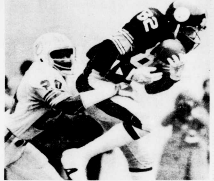
John Stallworth a marqué le deuxième touché des Steelers après avoir capté une passe précise de Terry Bradshaw.