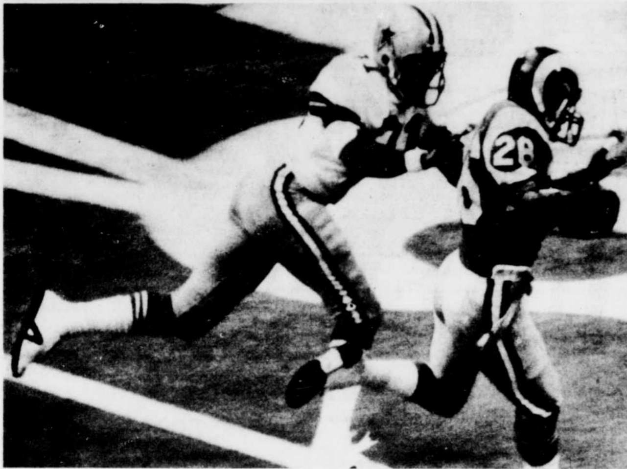
Le demi offensif, Wendell Tyler, marque un des touchés des Rams après avoir capté une passe du quart-arrière Vince Ferragamo.