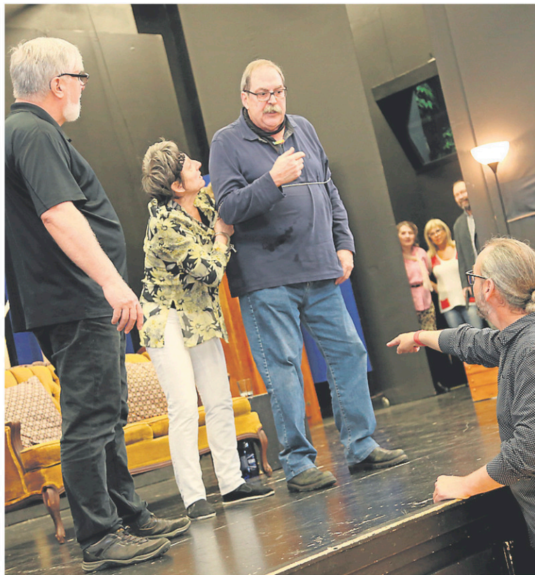
La troupe amateur Atelier théâtre en répétition pour la présentation de La veuve noire , en mai.

souligne-t-il. Tout le monde s'aime, s'encourage et s'aide. Tout le monde grandit ensemble à travers la troupe. J'ai vu des coquilles s'ouvrir complètement, se transformer. Qu'est-ce qui fait que je reste? La passion. L'amour du théâtre, l'amour des gens et, plus loin que ça, l'amour de voir les gens évoluer. De les voir changer. Si j'arrive à faire s'ouvrir les autres, moi aussi je grandis. C'est tout ça qui fait que je reste et qui fait que je vais rester encore longtemps.»