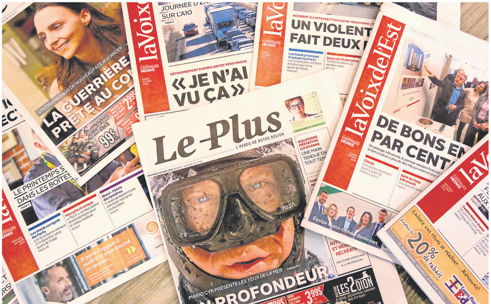
Dans un souci d'offrir l'information la plus complète au plus grand nombre, l'hebdo Le Plus se transformera ce printemps.