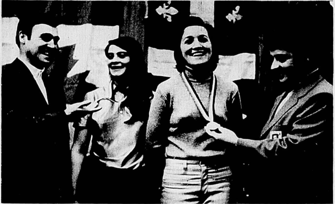
Les activités sportives et intra-murales ne manquèrent certes pas cette année au "CEGEP" trifluvien, dû en grande partie autant à la collaboration de l'administration sportive et collégiale qu'à la participation de la gent étudiante. Ainsi c'était la remise des médailles dans les