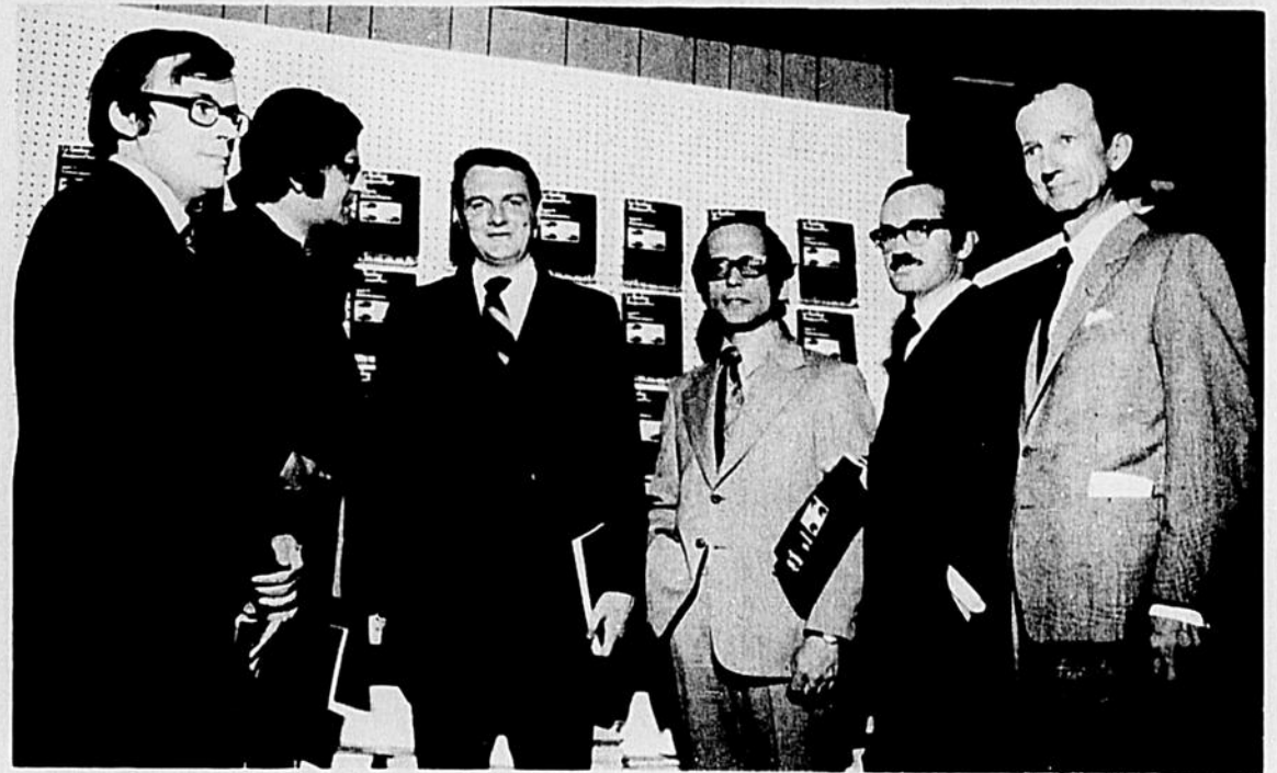
Les Editions Hurtubise-HMH lançaient il y a quelques jours un important recueil de textes originaux sur "Le Québec d'aujourd'hui - regards d'universitaires". Sur la photo prise lors de la réception on voit de g. à d. quel-