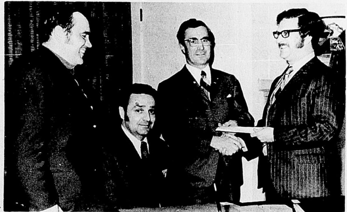
La Ligue Senior Inter-Cités qui débutait ses activités pour la présente saison connaît l'horaire et ses équipes au début d'une nouvelle saison. Celles-ci sont: Les Cardinaux de Ste-Cécile de Trois-Rivières, les Mets de St-Jean-Brébeuf, les Cavaliers de St-Tite, les Jets de Shawi-