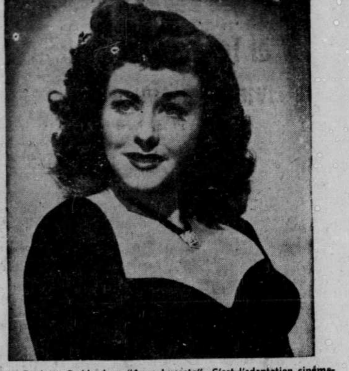
Voici Paulette Goddard en "Anna Lucasta". C'est l'adaptation cinématographique de la pièce de théâtre du même nom que le cinéma Palace présente cette semaine.