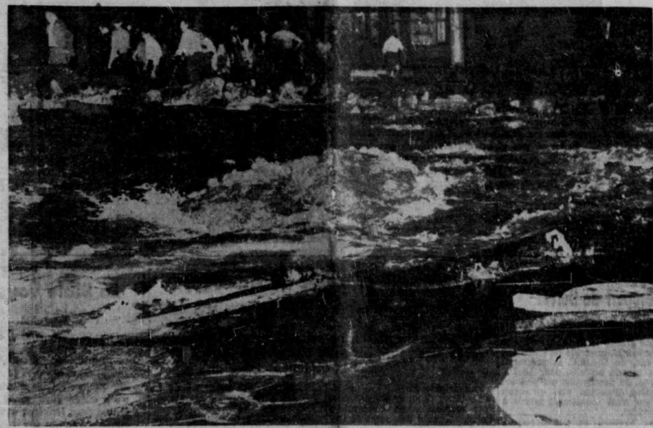
Un jet d'eau d'une hauteur de 20 pieds a causé tout un émoi hier, rue Atwater, alors qu'une conduite d'eau a éclaté. On voit ici les remous causés par l'eau qui tort encore après plus de trois heures. Les dommages sont considérables. L'eau s'est répandue sur une distance partant du canal Lachine jusqu'à la rue Workman et de la rue Atwater jusqu'à la rue Dominion. A certains endroits l'eau est montée jusqu'à 3 pieds au-dessus du trottoir.

Au dire du correspondant William Moore, il faudra du temps avant que l'ennemi reprenne l'offensive à fond sur le front de Taejon. Les Américains y ont détruit tous les ponts, tunnels, voies ferrées et grands chemins qu'ils ont pu à mesure de leur recul. Et l'aviation alliée ajoute à ce propos que son raid de bombardiers lourds dimanche sur Séoul y a laissé les voies de triage dans un tel état que les déplacements fer-