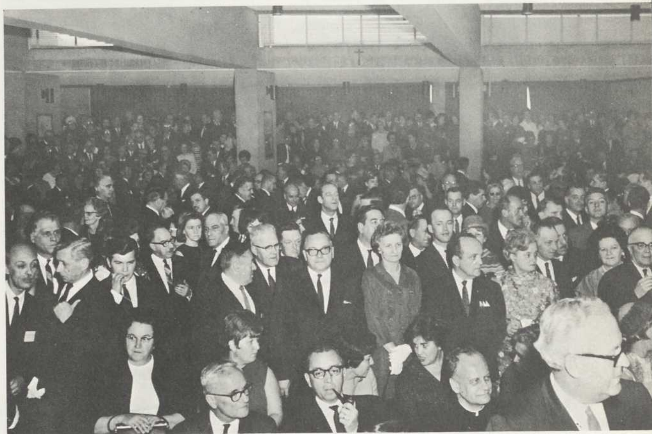
Une partie de l'assistance lors de l'inauguration de l'édifice de L'Assurance-Vie Desjardins.

« Un immeuble où l'on a voulu respecter la vérité du matériau. Symbole d'une institution vouée, en raison de son inspiration coopérati-