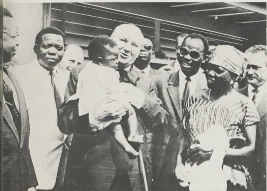
La paix ne se réduit pas à une absence de guerre, fruit de l'équilibre toujours précaire des forces, Elle se construit, jour après jour, dans la poursuite d'un ordre voulu de Dieu, qui comporte une justice plus parfaite entre les hommes. « Donnez-moi deux bombardiers », disait monsieur Raoul Follereau, c'est-à-dire la valeur en argent de ces deux engins de destruction et j'enraie la lèpre du monde. On voit ici le fondateur de la Journée mondiale des Lépreux, tout heureux de tenir dans ses bras un beau bébé quelque peu craintif. Monsieur Follereau est ici à la léproserie de la Rive au Congo. Il est entouré du Président de la République, M. Kasa Vubu (à l'extrême gauche) et de plusieurs membres du gouvernement congolais.

maux, s'applique avec intelligence et fermeté à les abolir. À cette prière doit correspondre l'engagement résolu de chacun, à la mesure de ses forces et de ses possibilités, dans la lutte contre le sous-développement. Puissent les personnes, les groupes sociaux et les nations se donner la main fraternellement, le fort aidant le faible à grandir, y mettant toute sa compétence, son enthousiasme, et son amour désintéressé. Plus que quiconque, celui qui est animé d'une vraie charité est ingénieux à découvrir les causes de la misère, à trouver les moyens de la combattre, à la vaincre résolument. Faiseur de paix, « il poursuivra son chemin, allumant la joie et versant la lumière et la grâce au cœur des hommes sur toute la surface de la terre, leur faisant découvrir par delà toutes les frontières, des visages de frères, des visages d'amis ». 5 — 75