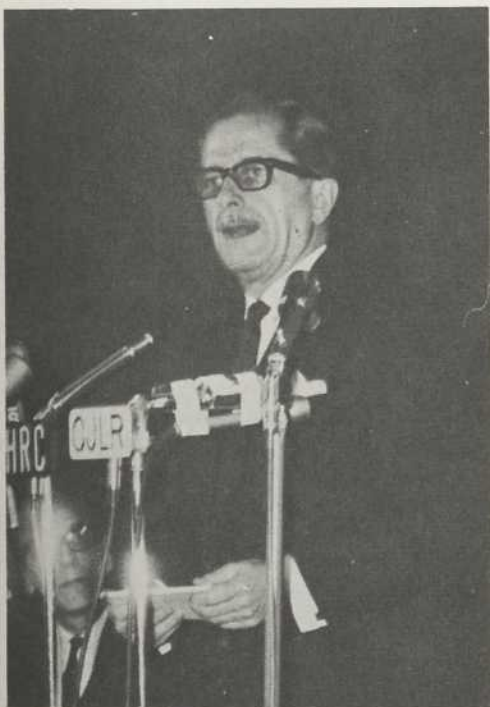
L'honorable Daniel Johnson.

Je suis toujours extrêmement heureux et extrêmement fier de prendre contact avec les responsables d'une grande réussite québécoise. C'est un plaisir de choix qu'il m'est donné de savourer bien souvent puisque les grandes réussites québécoises vont se multipliant dans tous les domaines.