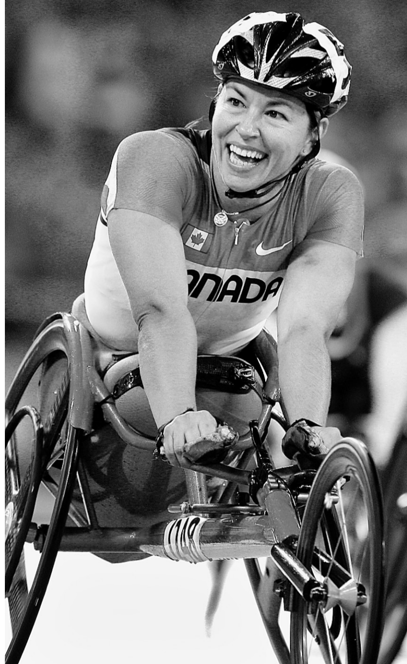
Chantal Petitclerc est la deuxième athlète paralympique à recevoir le trophée Lou-Marsh.