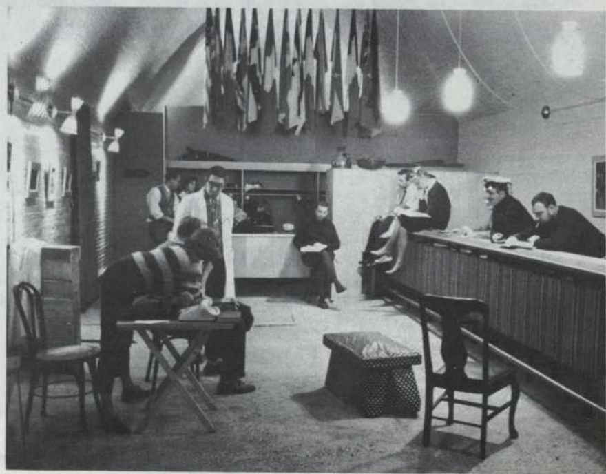
A rehearsal of the German Section at "La Poudrière" Détente dans le foyer de la Poudrière au cours d'une répétition de la Section Allemande.