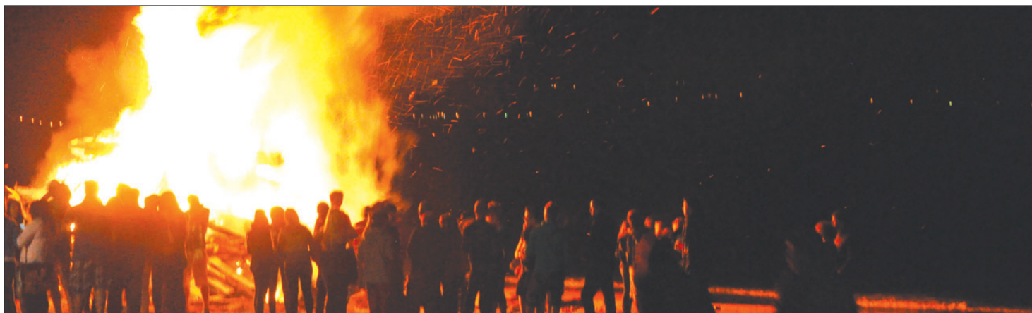
Deux feux de joie allumés jeudi et samedi ont égayé la plage.