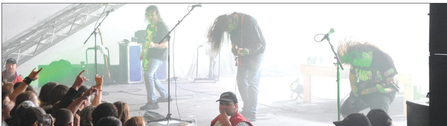
Le groupe Alchoolica (Hommage à Metallica) a attiré, avec Jonas and the Massive Atraction, plus de 3000 personnes sur le site.