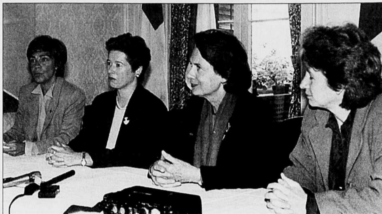
RENE MATHIEU LE DEVOIR

Lors de sa réunion d'hier, le groupe de travail a rencontré les porte-parole de la Coalition pour la diversité culturelle, un organisme québécois dans lequel se retrouvent les principales associations liées à la culture au Québec,