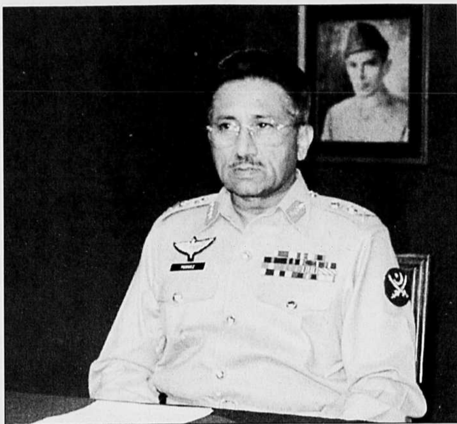
Le général Parviz Mosharrarf, commandant des putschistes, s'adressant à la nation.

Par ailleurs, le glissement graduel récent de la politique d'Islamabad envers les