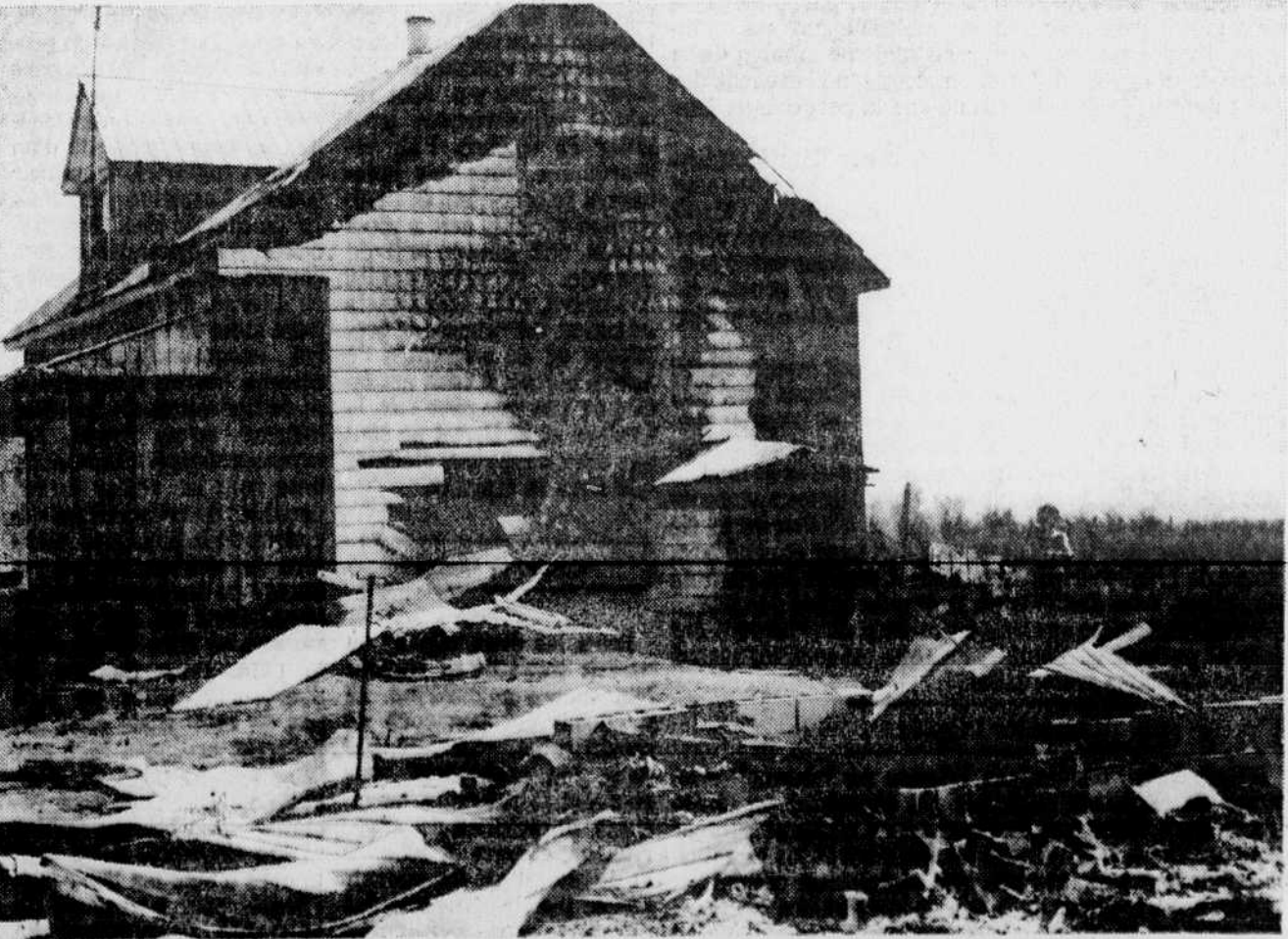
Deux familles ont été jetées sur le pavé à la suite d'un incendie qui a rasé une maison-moblie et qui a lourdement endommagé une maison tôt hier matin

"Un donneur de sang peut donner légèrement moins d'une chopine, ce qui équivaut seulement à un quinzième du volume moyen de l'organisme qui est de douze chopines, soit environ 8% du poids total du corps."