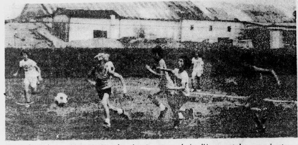
"Fais mois une passe"! C'est le cri qu'on entend régulièrement dans une joute de soccer. Plus de 400 jeunes de la Cité de Thetford Mines sont des adeptes de ce beau sport.

tionné par le Service des Loisirs de Thetford Mines, mais pour cette année, le gouvernement fédéral, par l'entremise des Perspectives-Jeunesse, donne une sérieuse aide. Notre but premier est de recruter des jeunes et surtout de les faire évoluer dans l'exercice de ce sport", de dire M. Dupuis.