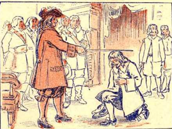
En récompense des grands services qu'il avait rendus à la Nouvelle-France, Robert Giffard est anobli en 1658, par lettres-patentes signées de la main du roi de France, Louis XIV.