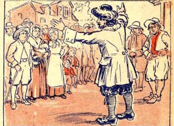
Retourné en France après la prise de Québec par les Anglais, en 1629, Giffard raconte aux gens de Mortagne, ses compatriotes, les merveilles du Canada. Il leur décrit en termes captivants son grand fleuve, ses immenses forêts, la fertilité du sol.