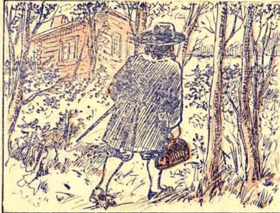
Robert Giffard, l'instigateur de ce mouvement d'émigration, né dans la paroisse de Saint-Jean-Baptiste, à Mortagne-au-Perche, avait visité Québec en 1627, comme chirurgien de l'habitation de Champlain. Il s'était alors construit une maison, près de la petite rivière de Beauport.