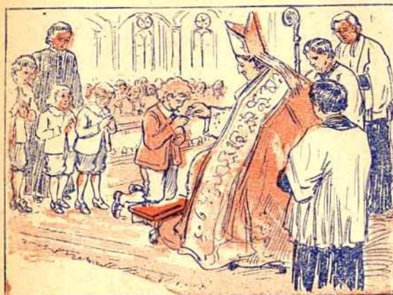
Giffard se bâtit un manoir seigneurial au bord de la petite rivière de Beauport. Un prêtre vient y célébrer la messe, les dimanches et les jours de fêtes d'obligation; en 1660, Mgr de Laval y administre le sacrement de confirmation. Pour la circonstance il y a grande fête au manoir.