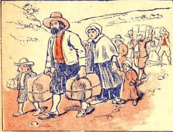
Les premiers colons qui passèrent au Canada, avec l'intention de s'y établir et de cultiver la terre, venaient principalement du Perche, riche province du nord de la France. Au delà de cent cinquante familles canadiennes tirent leur origine de cette province.