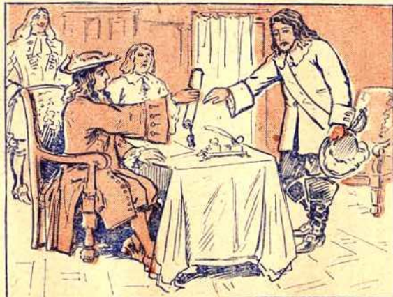
Le Canada ayant été rendu à la France par le traité de Saint-Germain-en-Laye, Giffard décide de revenir en Nouvelle-France. Le 15 janvier 1634, Louis XIII lui concède, de chaque côté de la rivière de Beauport, une grande étendue de terrain. C'est l'ancienne seigneurie de Beauport, dont Giffard est le premier seigneur.