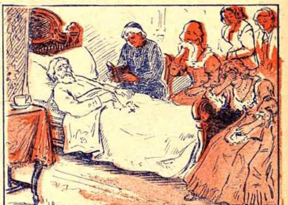
Le 14 avril 1664, Robert Giffard s'éteint dans son manoir, à Beauport. Le JOURNAL DES JÉSUITES nous dit qu'"il est mort fort chrétiennement, assisté du Père Carheil, tout le temps de sa maladie." Giffard a droit à la vénération des Canadiens français. Il est avec Louis Hébert "l'un des fondateurs de la colonie française du Canada et le type du seigneur colonisateur", au dire de l'historien Salomé.