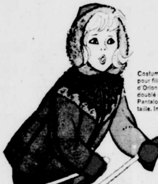
Costume de ski en "Antron" pour fillette. Veste garnie d'Orlon* et douillet capuchon doublé d'Orlon* à long poil, Pantalon montant haut à la taille. Imperméable.