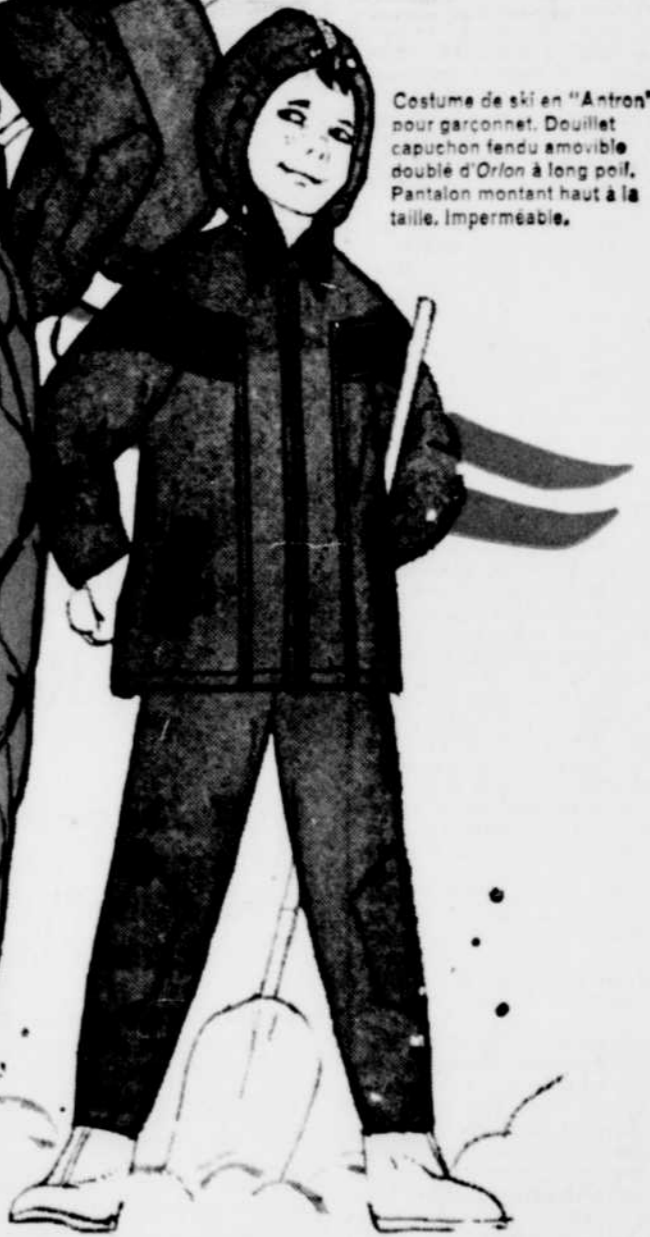
Costume de ski en "Antron" pour garçonnet. Douillet capuchon fendu amovible doublé d'Orlon* à long poil, Pantalon montant haut à la taille. Imperméable.

Il est temps d'acheter les costumes de neige et voici un moyen sûr d'obtenir les meilleurs vêtements d'hiver. Demandez les costumes "Tiger Tuff" faits d'un tissu solide, résistant et élégant, en nylon "Antron". La qualité "Tiger Tuff" et le nylon "Antron" confèrent à ces robustes costumes toutes les caractéristiques voulues pour qu'ils donnent le meilleur service tout le long de l'hiver: