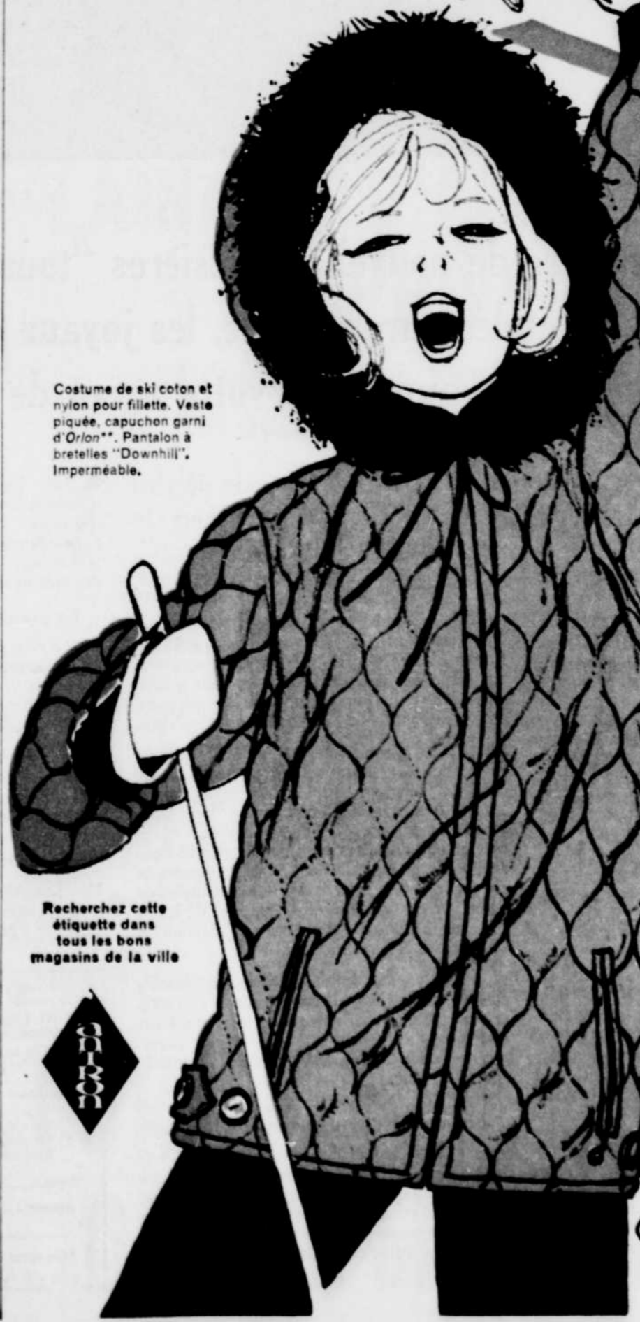
Costume de ski coton et nylon pour fillette. Veste piquée, capuchon garni d'Orlon*, Pantalon à bretelles "Downhill", Imperméable.