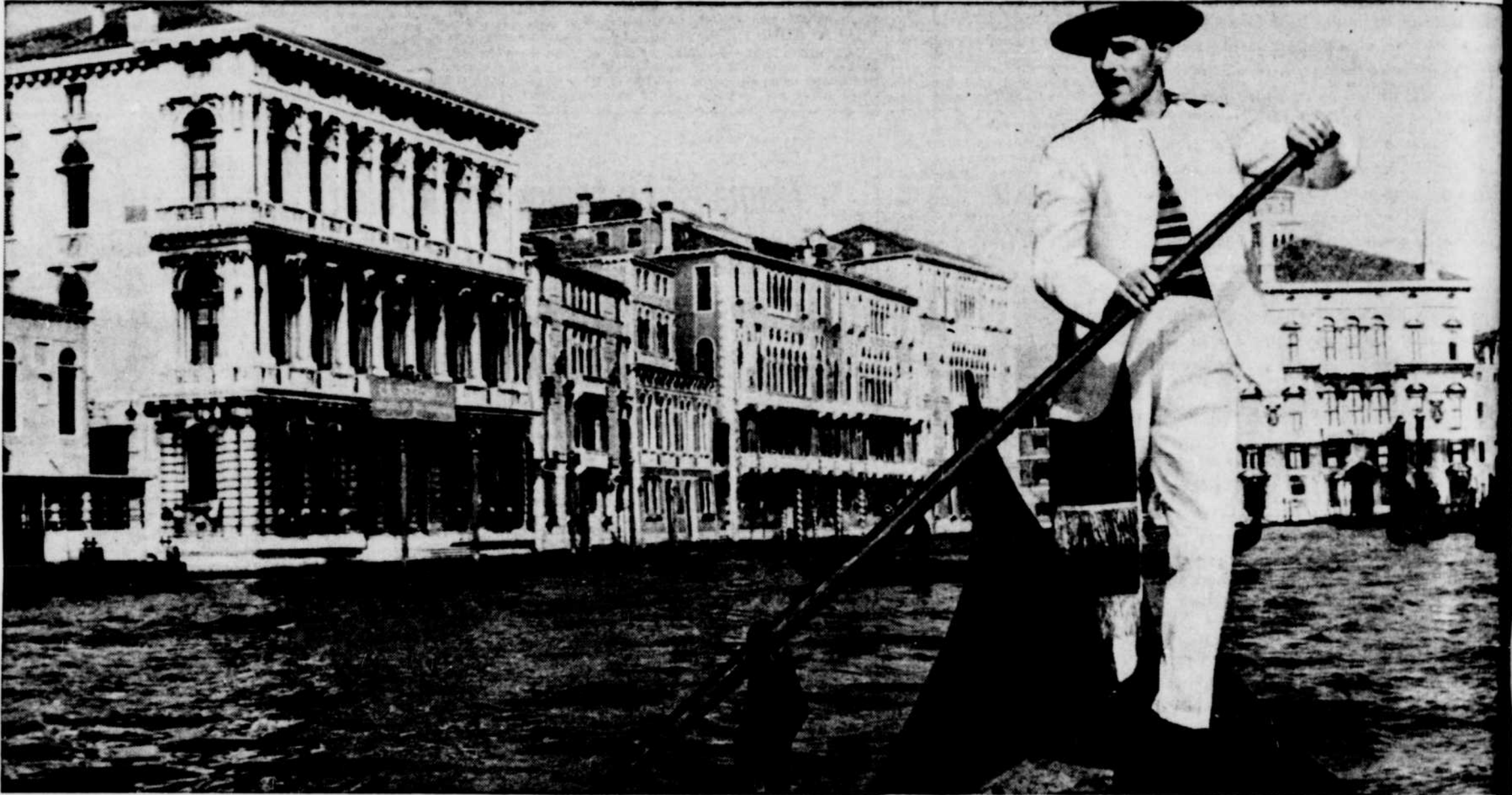
Venise, escale eschanteuse de plusieurs des itinéraires européens "tous frais compris" de KLM.