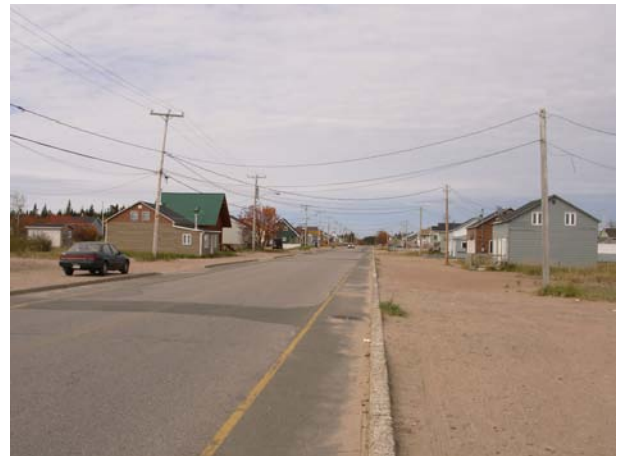
Une rue d'une réserve innue sur la Côte Nord au Québec.

Le travail d'André sur l'habitat et le bâti, et mes propres travaux sur l'éthique, la culture contemporaine et la maison se rencontrent autour d'une question radicale : comment habiter ensemble aujourd'hui? Comment vivre, ici, avec soi et avec autrui? Voilà des questions qui se posent de tout temps. Devant des réalités et des exigences différentes, comment répondre?