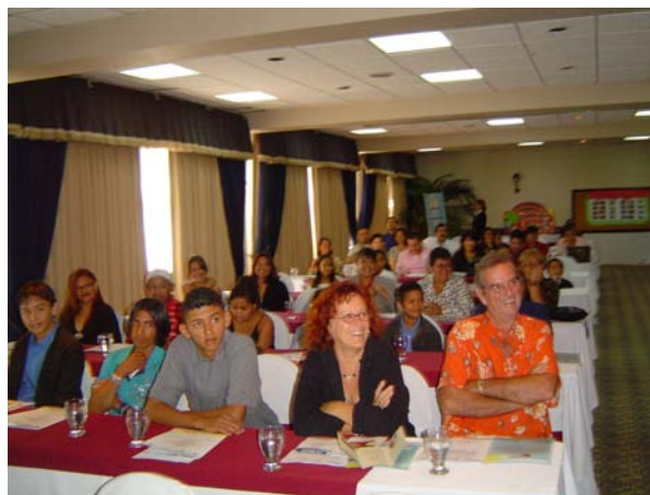
Une partie de l'assistance.

La préparation du colloque s'est faite dans un contexte où l'internet n'est guère accessible à la majorité et où les invitations doivent être remises en mains propres aux invités. Ajoutons que les adresses civiques sont très originales en Amérique centrale. Par exemple, l'organisme Compartir a comme adresse : « La maison derrière le gros arbre à côté de la pharmacie après le deuxième feu de circulation passé le MacDo sur le boulevard Morazan (dans le quartier Subirana) ». Il s'est donc agi de remettre en mains propres les 135 invitations, une dizaine de jours avant l'événement prévu. Précisons que ces façons de faire, étrangères à nos normes nord-américaines, possèdent dans les faits leur logique et leur efficacité : les invités sont enchantés de recevoir