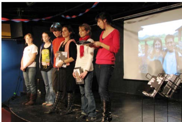
Le comité responsable de la revue lors du lancement des Retombées de Liaisonneuve XV .