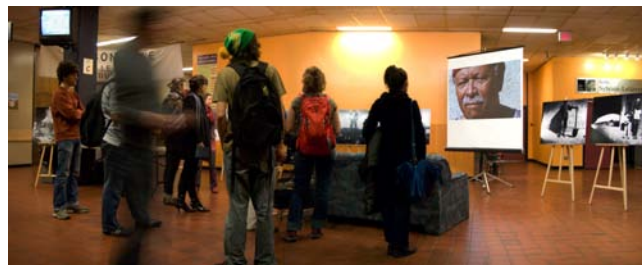
Les étudiants ont été nombreux à venir rencontrer les artistes et apprécier les photos du projet Humanidad : les enfants travailleurs du Nicaragua.