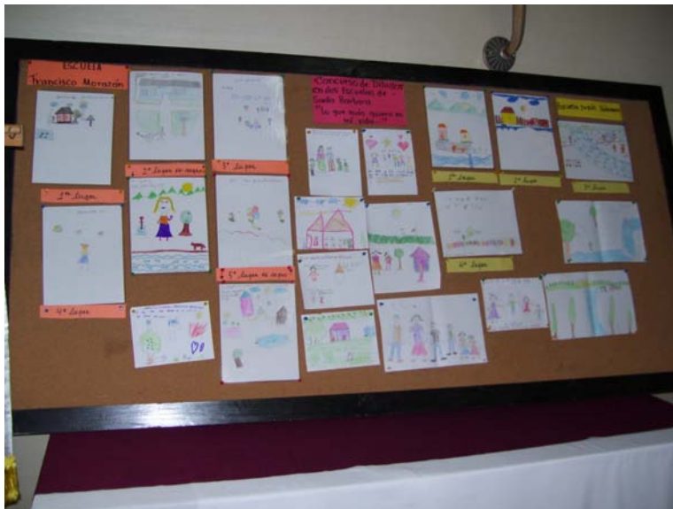
Le concours de dessin.