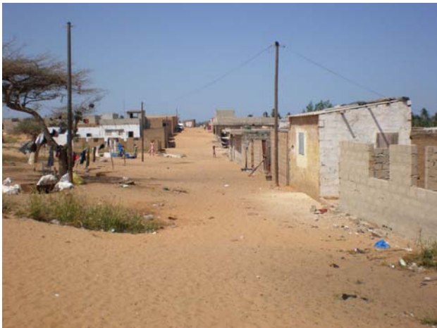
Une rue d'un quartier au Sénégal.