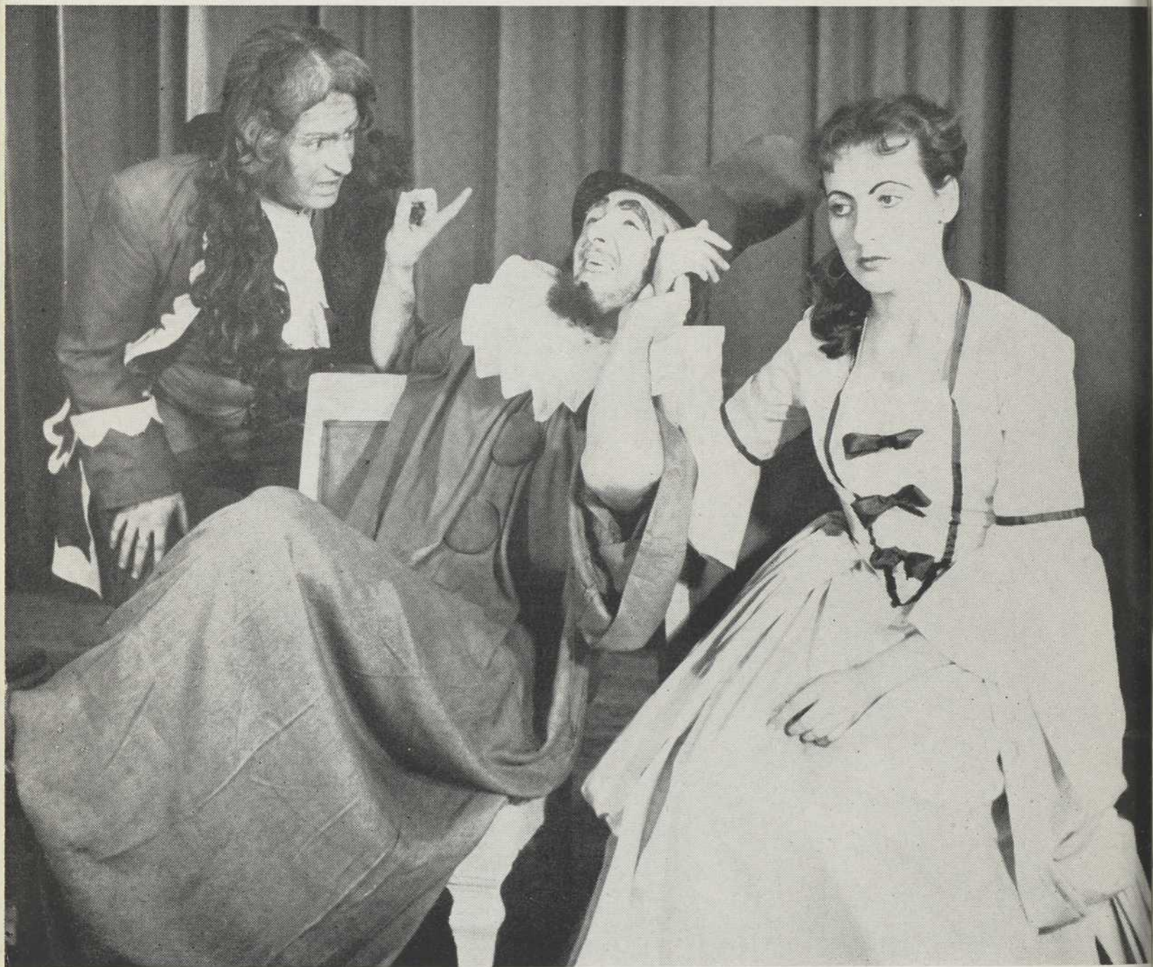
du "Médecin malgré lui", chez les Compagnons, décembre 1946 Géronte, Sganarelle et Lucinde