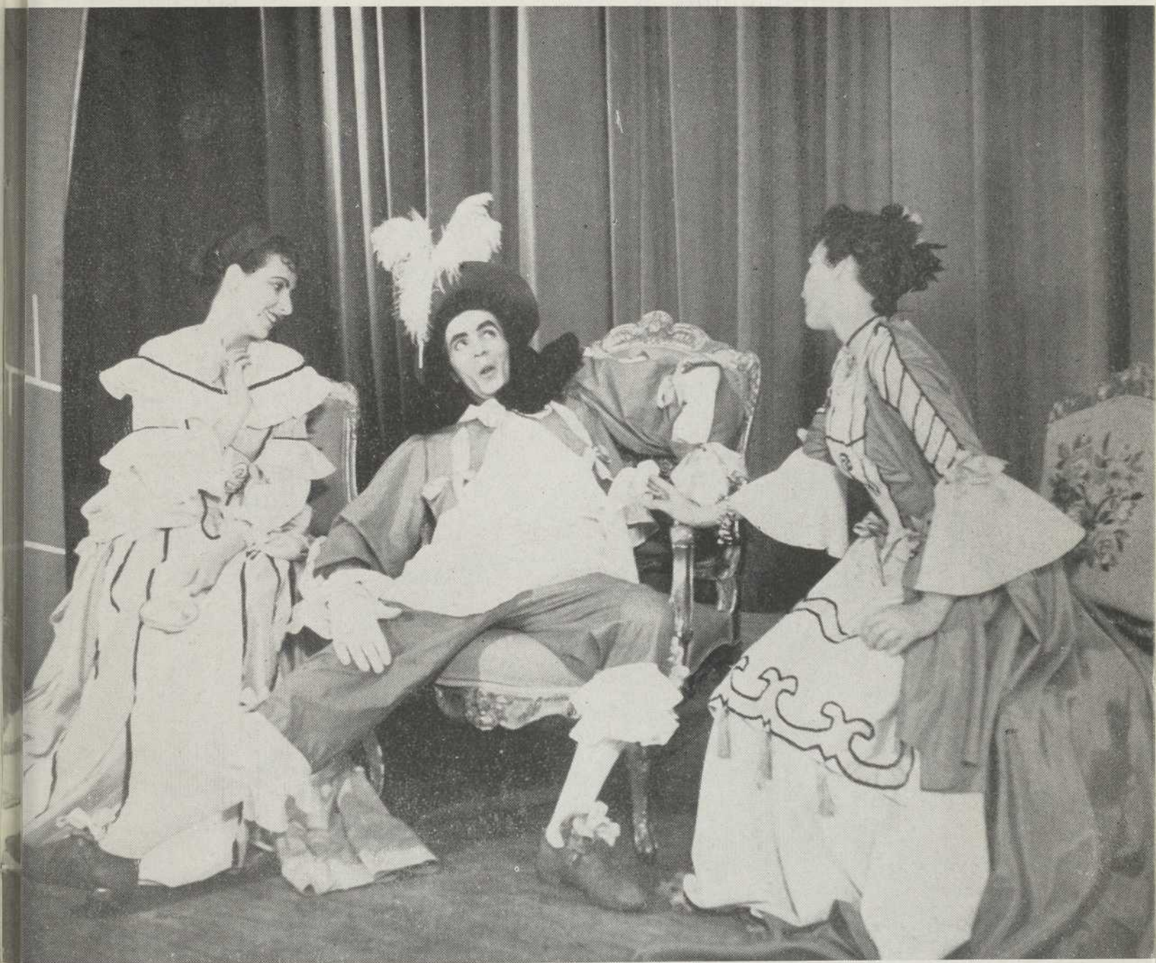
"Les Précieuses ridicules", chez les Compagnons, décembre 1946