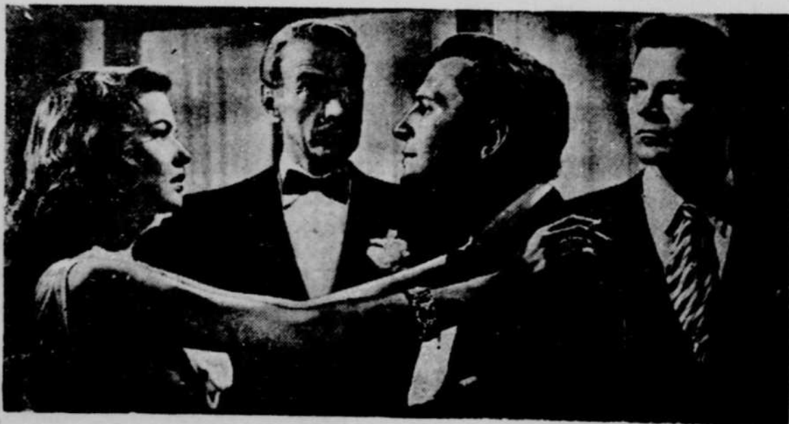
Scène du grand film dramatique "Laura", qui passera à l'affiche Cinéma Cartier.