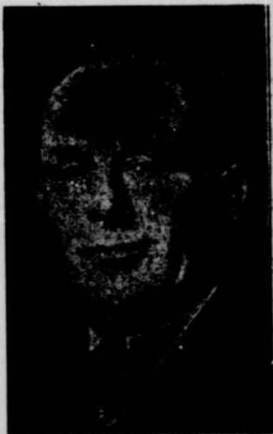
Candidat à l'échevinage, pour le siège No 4