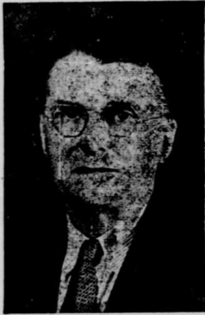
Candidat à la mairie

"sauf le commissaire en chef, l'un des commissaires est nommé sur consultation d'organisations représentatives des travailleurs, et l'autre sur consultation d'organisations représentatives des employeurs", le commissaire en chef étant nommé par le gouverneur en conseil pour représenter le gouvernement canadien. Cet article de la loi place donc à la direction de la Commission, le capital et le travail. C'est la première reconnaissance du principe de la représentation égale.