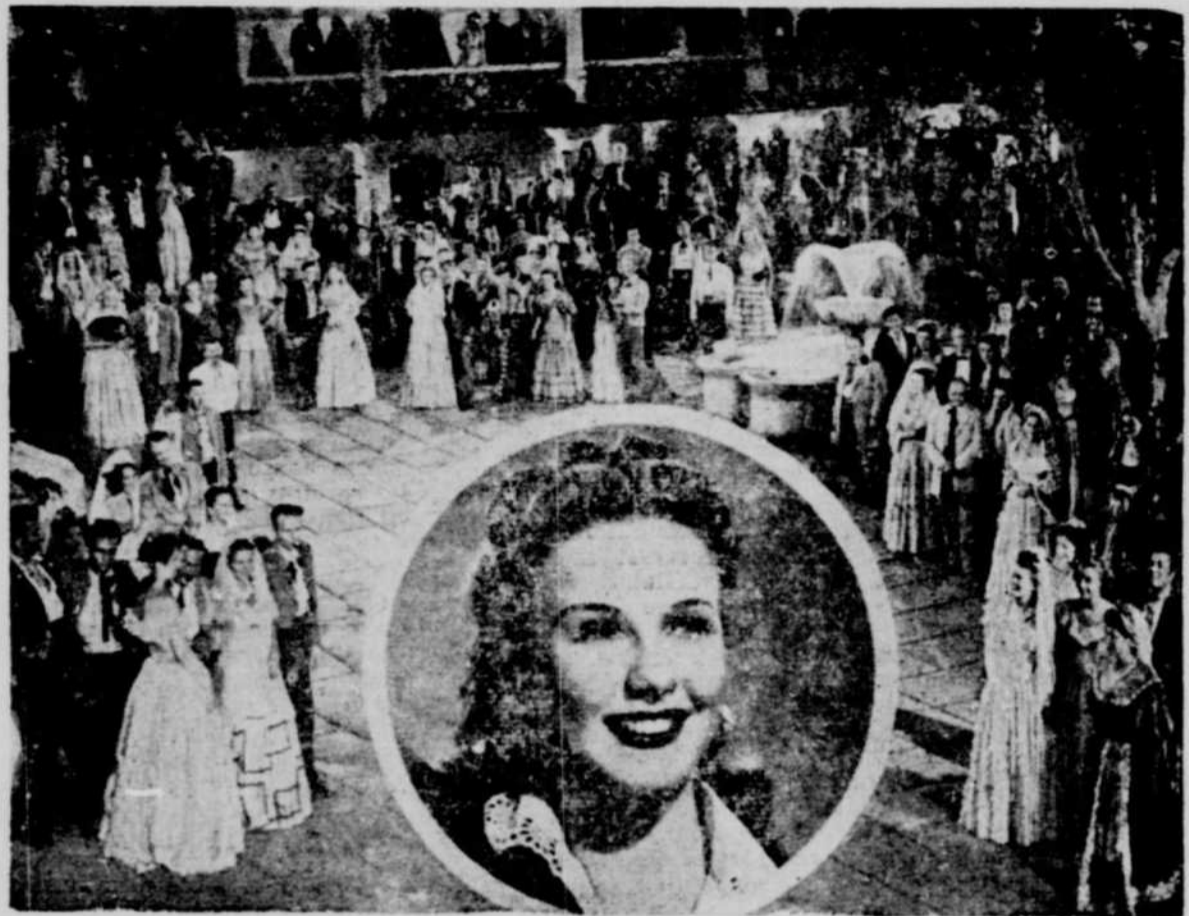
Une scène du premier film en couleurs de Deanna Durbin: "Can't Help Singing", à l'affiche du théâtre Impérial pour 4 jours, les 25-26-27 et 28 février. — Il y aura représentation continue dimanche et une matinée à tous les jours durant ce programme.

C'est une loi universelle que la révolte de l'esprit contre Dieu est punie de la révolte des sens contre l'esprit. Le rationalisme est la révolte la plus universelle de l'homme contre Dieu et son Verbe. Il doit donc signaler ses progrès par un débordement inouï des mauvaises moeurs.