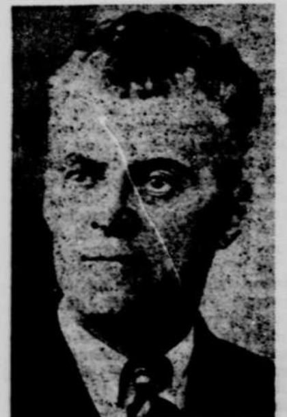
Candidat à l'échevinage, pour le siège No 3