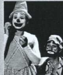
Goblet (blanc) et Sol (rouge)