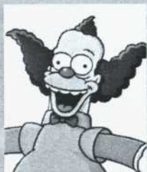
Krusty le clown (rouge)