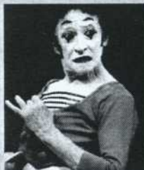
Mime Marceau (blanc)