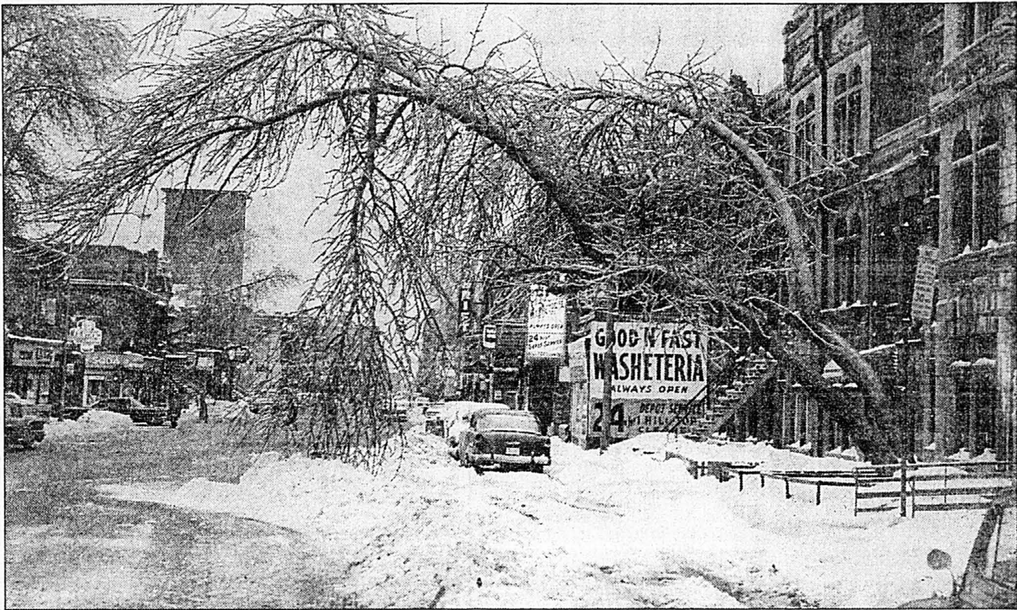
Deux époques, deux tempêtes de verglas, mêmes résultats...

Il s'est fait depuis quelques années, à Montréal et dans la région comme dans le reste de la province, beaucoup de grands travaux qui ont nécessité des excavations. En a-t-on profité pour enfouir sous terre les fils électriques et téléphoniques partout où cela était possible? Est-il nécessaire d'attendre soit une tempête comme celle-ci, soit des travaux d'urbanisme qui en fournissent l'occasion, pour faire ce travail d'enfouissement? Ne devrait-on pas l'entreprendre selon un plan bien établi et en faire un peu chaque