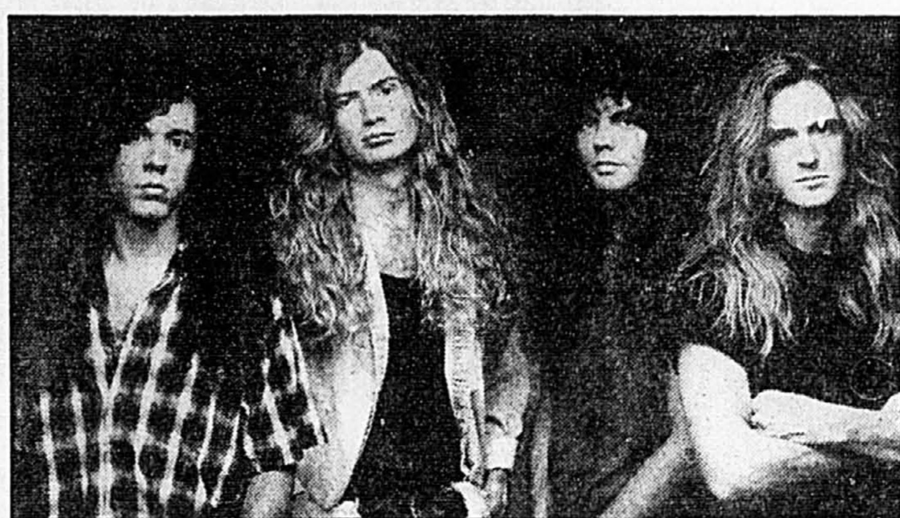
Megadeth : Marty Friedman, Dave Mustaine, Nick Menza, David Ellefson

Plusieurs groupes font une bonne chanson, et ils traitent leur public comme de la merde. Pas nous. On est chanceux de faire des