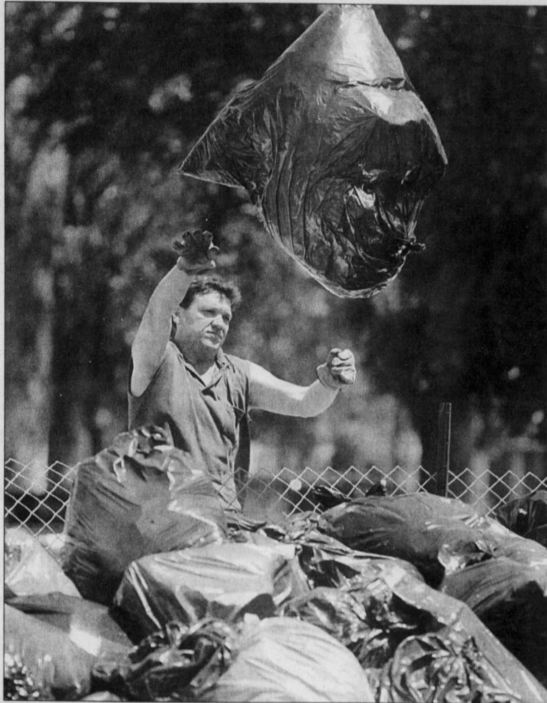
Un homme lance son sac de déchets dans un dépotoir improvisé dans un parc de Toronto.