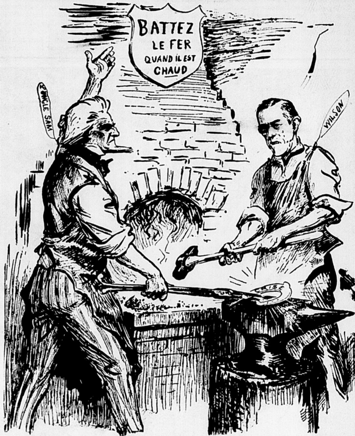
Il est temps de se décider