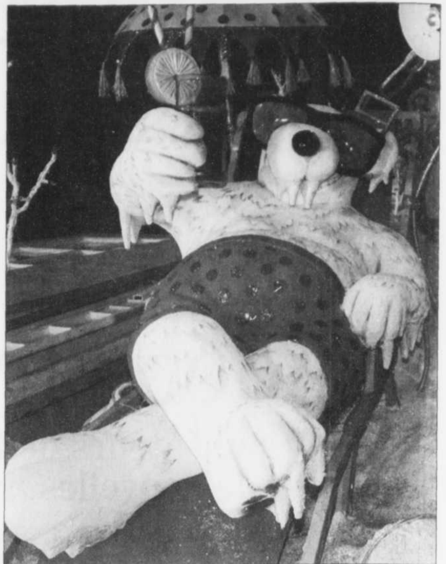
Le style des dessins et des personnages de Gaboury a été préservé.