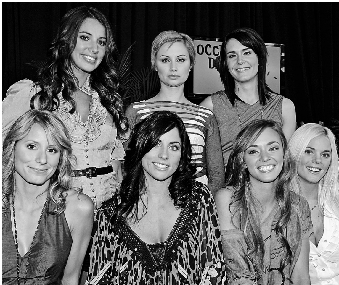
La sixième saison d' Occupation double , qui a rivé deux millions de téléspectateurs devant leur petit écran cet automne, a pris fin à TVA hier soir.

Sinon, les candidats d' OD ou du Loft qui ont généré le