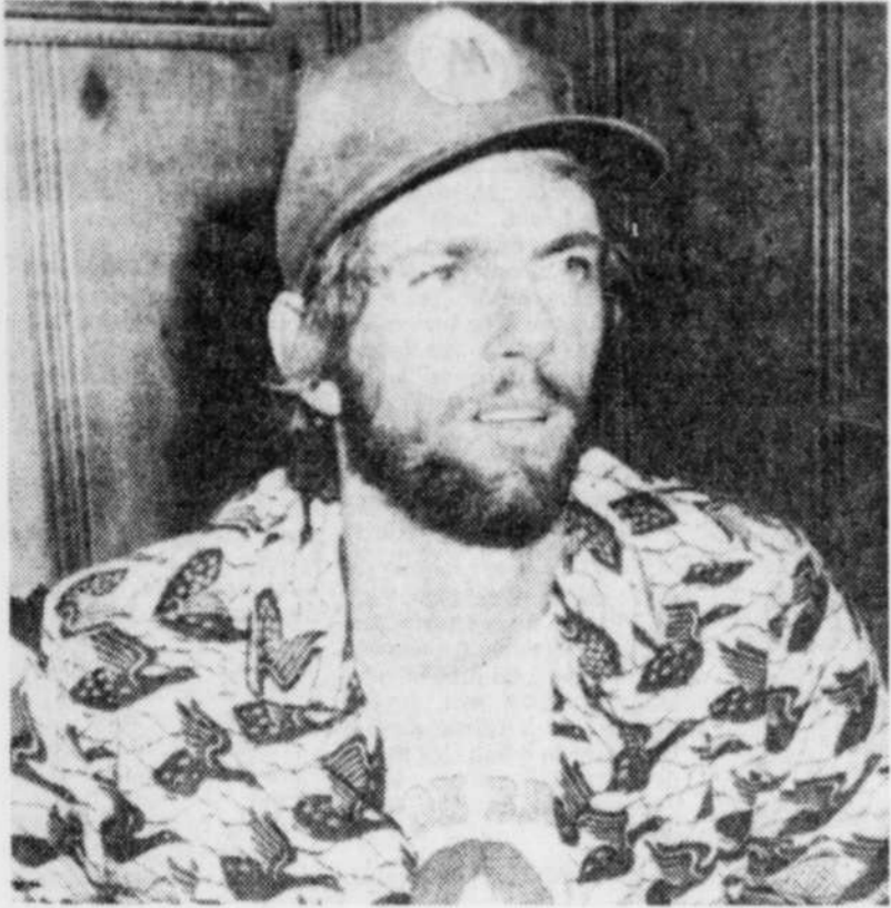
Voici quelle allure avait Bill Lee, hier, lors de la conférence de presse au cours de laquelle il s'en est pris au commissaire du baseball.