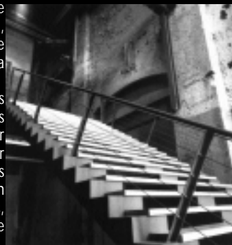
Vue intérieure du mail industriel du Technopôle Angus