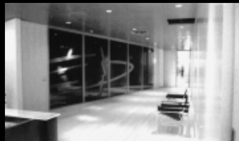
Bureaux de Bell Sygma à Montréal