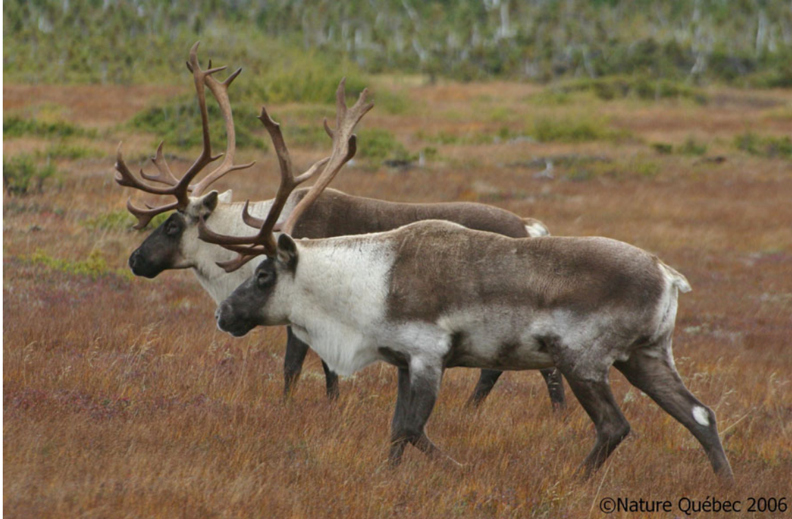
Figure 1 – Le Caribou forestier ( Rangifer tarandus tarandus )