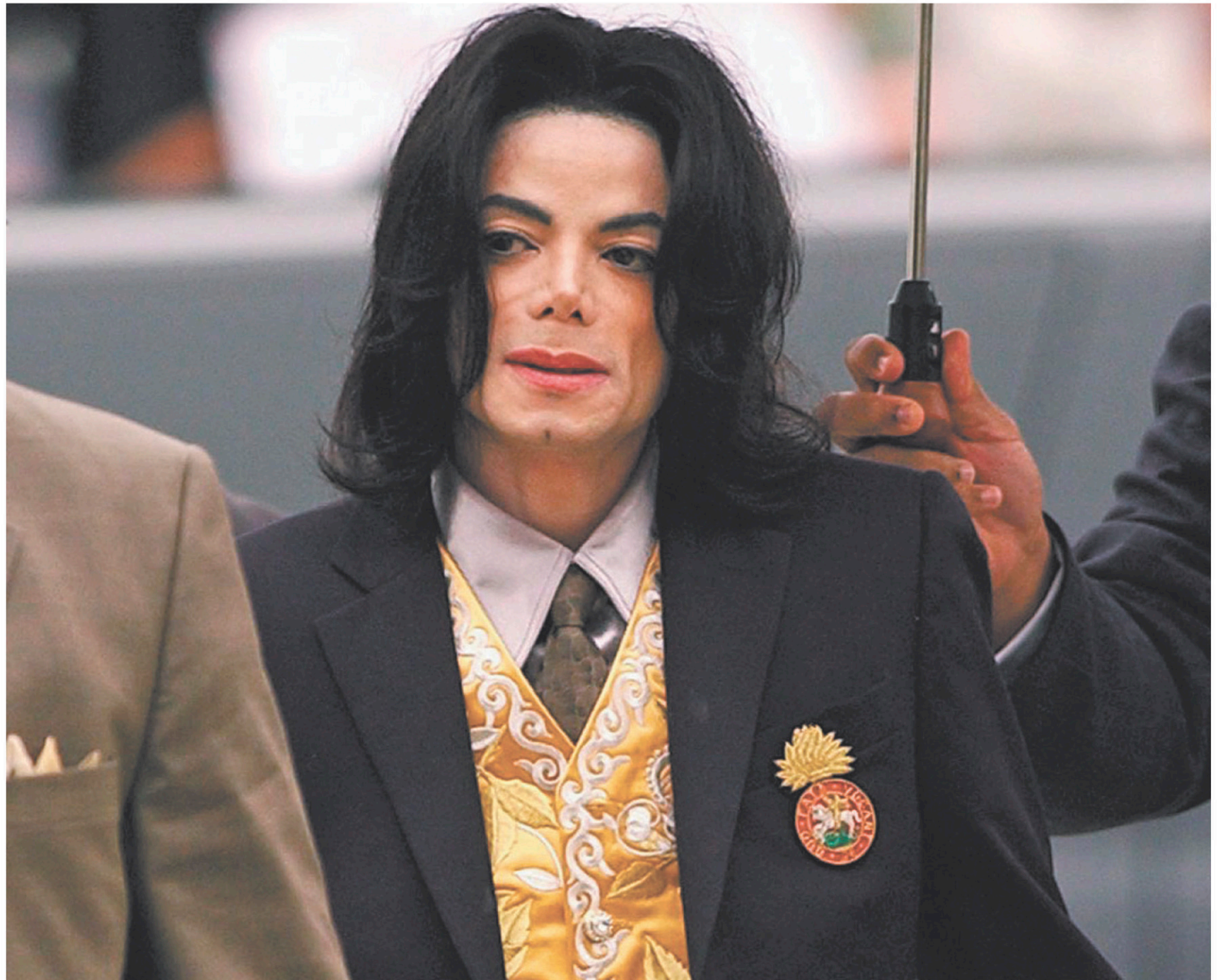
Michael Jackson à son arrivée au palais de justice de Santa Barbara en mai 2005 pour répondre à des accusations de pédophilie

De son côté, Radio-Canada explique privilégier sur Ici Musique des contenus canadiens et francophones, mais ajoute que « tout en suivant avec attention l'évolution du dossier, la direction laisse à ses équipes la liberté ou non de programmer une chanson de Michael Jackson, tout en rappelant qu'il