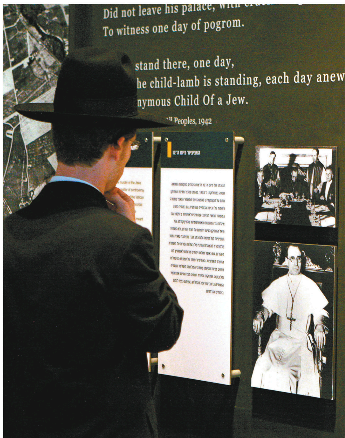
Un juif regarde un panneau consacré au pape Pie XII au Mémorial de la Shoah de Yad Vashem, à Jérusalem.