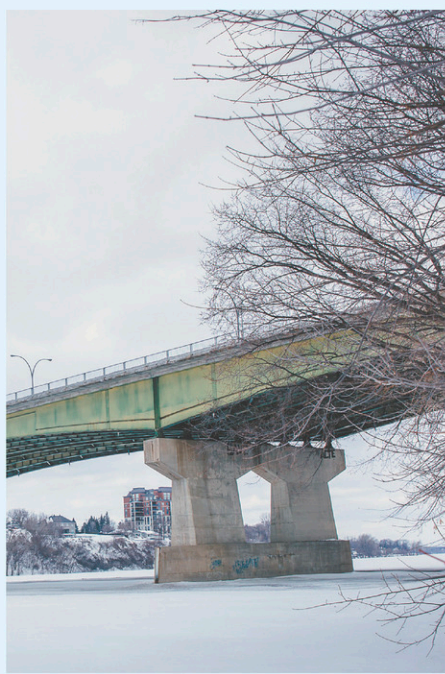
Le pont Pie-IX VALÉRIAN MAZATAUD LE DEVOIR