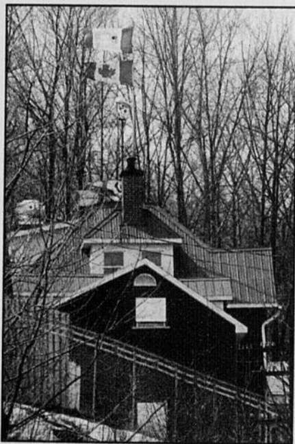
Lennoxville étudie la possibilité d'exiger le démantèlement des fortifications du bunker des Hells Angels.

En juin 1997, le ministère de la Sécurité publique a fait voter une loi modifiant d'autres lois, entre autres celle sur l'aménagement et l'urbanisme, afin de contrer la prolifération du crime organisé, indique-t-on au ministère des Affaires municipales.