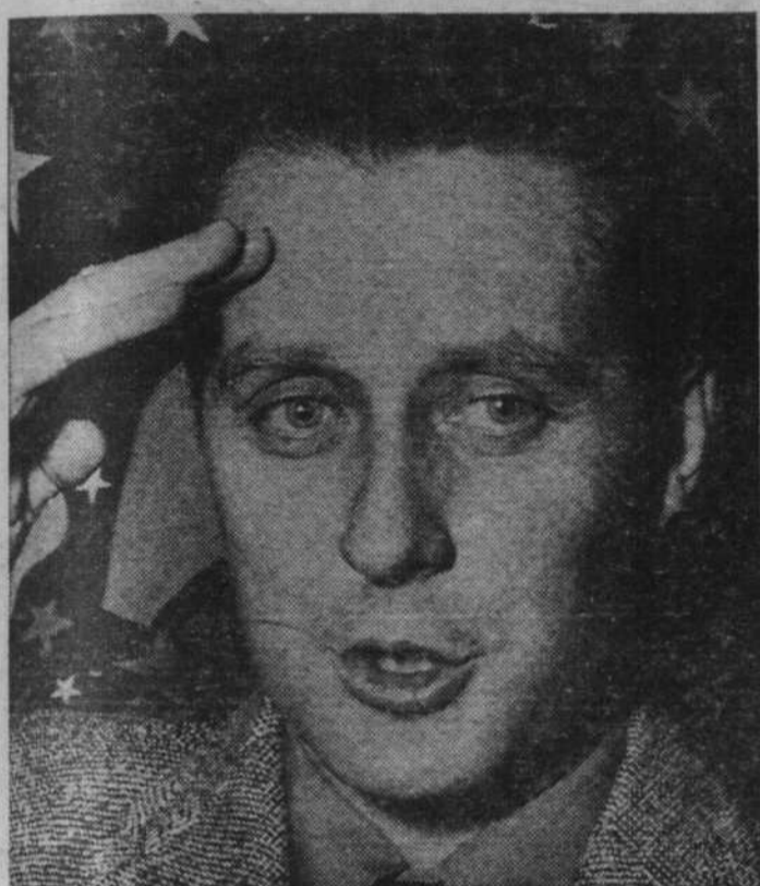
En '58, j'en avais jusque-là!