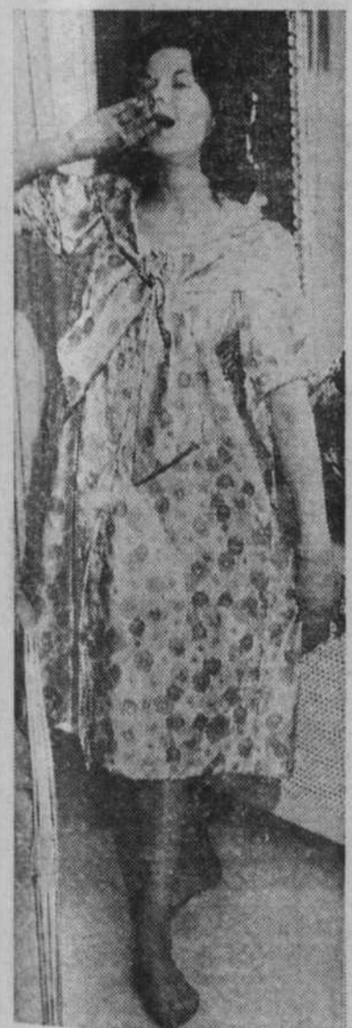
Saut de lit en beauté... Même au réveil, les femmes se doivent d'être belles, la Reine l'a bien compris. Ce négligé, qui porte si peu son nom, est en coton frais et léger, imprimé dans les tons de bleu et de vert.