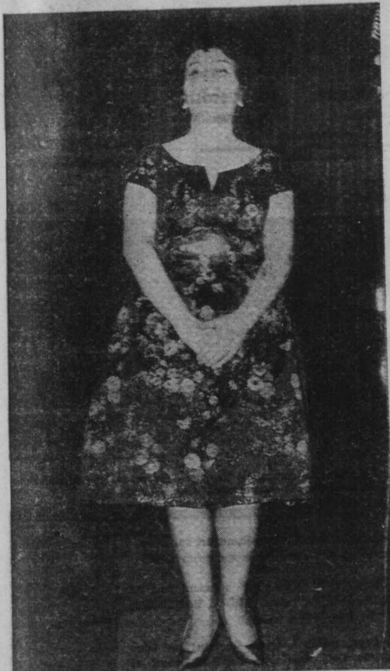
Gloria Lasso, la super vedette du disque, en primeur à Québec!