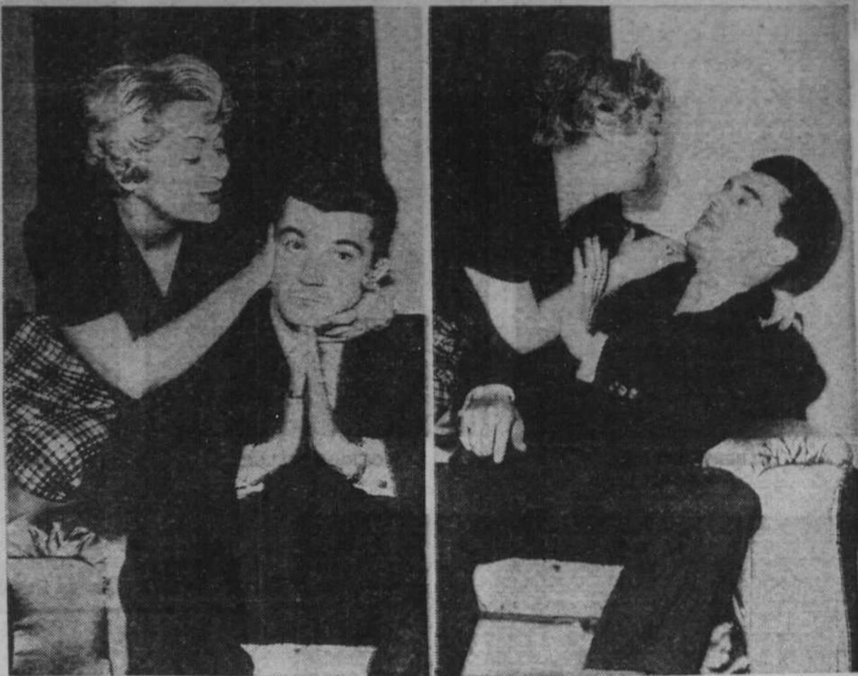
Approches adroites et mesurées pour séduire un homme !

Elle s'appelle Nina par-dessus le marché. Et là, il ne peut s'agir que d'un hasard, un hasard comme il ne s'en produit