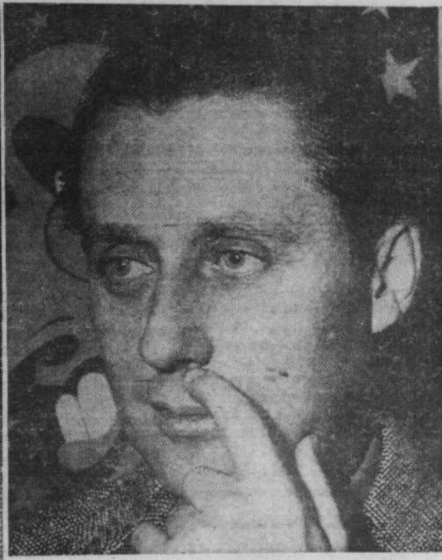
Maintenant, ça va! (Voir page 3)