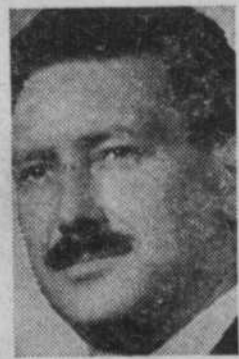
G. FORTIER directeur et auteur

3960 ST-DENIS — AV. 8-3054 — AV. 8-4021 HULL: PR. 7-1344