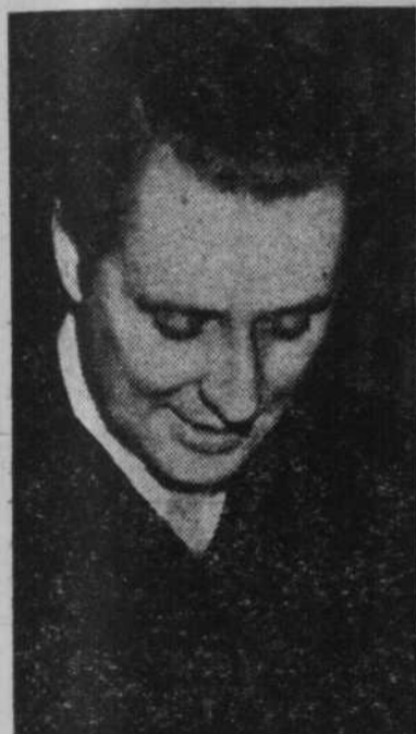
NORMAND : trop généreux

Un hebdo a parlé de dettes de $50,000 à l'impôt canadien. Un autre, récemment, a annoncé que Jacques Normand était au bord de la faillite. Ces manchettes étaient pour le moins exagérées. Elles faisaient écho à une situation financière sûrement mauvaise, pour l'artiste, mais elles grossissaient démesurément l'importance du déficit.