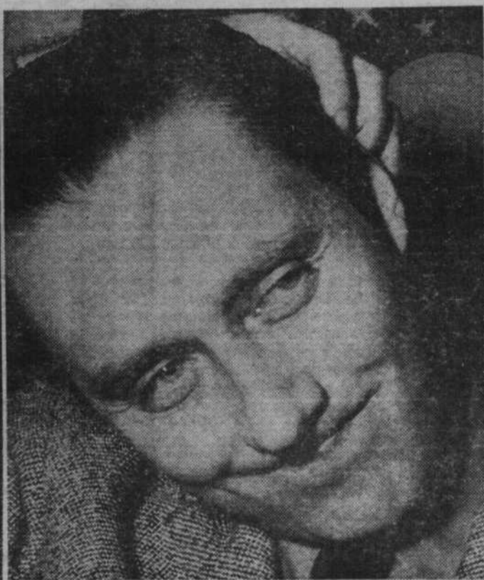
Là-bas, j'ai peiné afin de tout régler.