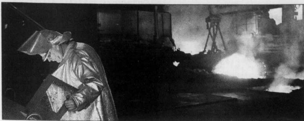
Un travailleur chez Arcelor. Le groupe européen est parti à l'assaut de Dofasco fin novembre.