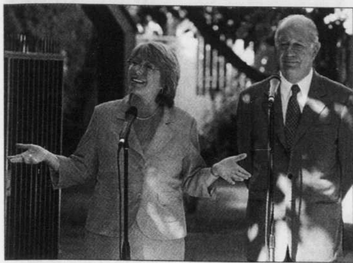
Michelle Bachelet (à gauche) en compagnie de son prédécesseur Ricardo Lagos.