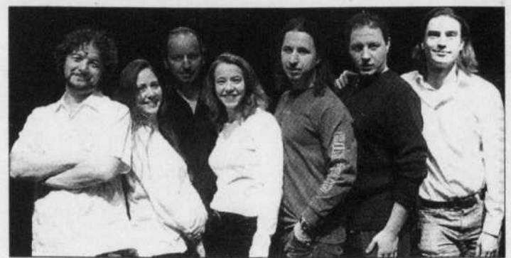
Avec Daniele Finzi Pasca, à gauche, l'équipe de création de la cérémonie de clôture des Jeux olympiques à Turin.

« La cérémonie de clôture, c'est un gros party avec un arrière-goût des deux amers , a résumé Marco Balich, de K2006/Groupe Film Master, la firme milanaise responsable de la production de la cérémonie. « C'est la fin des jeux, mais c'est aussi 2h30 d'un spectacle regardé par deux milliards de téléspectateurs. La cérémonie des oscars a été dé-