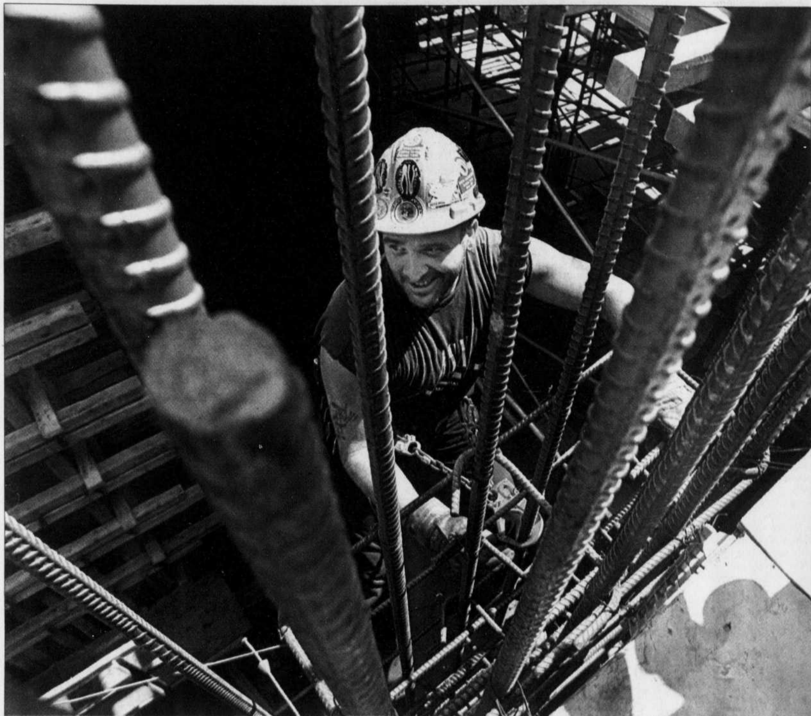
La construction pour les chantiers hydroélectriques, la construction d'hôpitaux, de pavillons universitaires, de centres commerciaux et pour les travaux de voirie sont des domaines où les éditions Jobboom recensent des besoins croissants de main-d'œuvre.