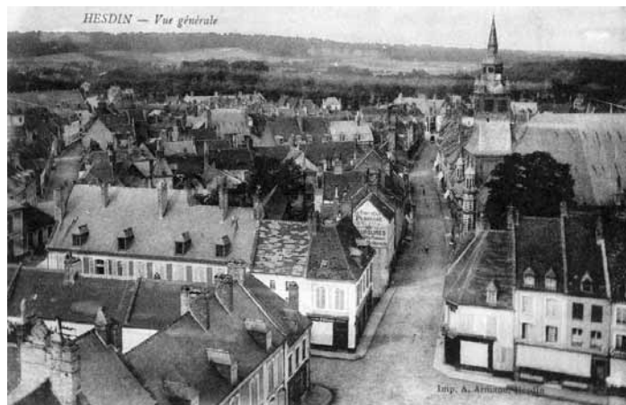
Vieille carte postale de Hesdin

L'Artois comprenait deux grandes villes, Arras et Saint-Omer, cinq villes moyennes dont Hesdin et plusieurs bourgs de moindre importance. Il est difficile de connaître la population d'Hesdin car il n'y avait pas de recensement à cette époque. Les historiens doivent donc extrapoler les données d'une autre façon. Après l'annexion de Calais par les Anglais en 1347 et la capture du roi Jean Le Bon à la bataille de Poitiers, l'Artois a été obligé de participer au paiement d'une rançon importante pour sa délivrance. Pour déterminer comment rembourser l'impôt à payer, la ville d'Hesdin a comptabilisé le nombre de familles qui