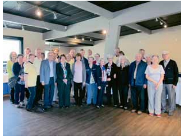
Groupe des participants à l'assemblée annuelle et à la visite de l'Aquarium

l'Association sur une clé USB au coût de 35 $ ou sur un DVD au prix de 20 $.