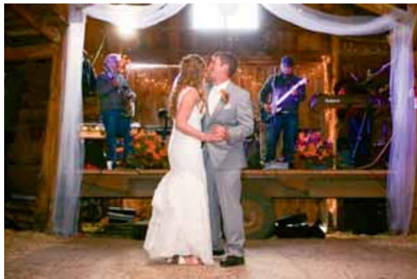
L'heureux couple partageant leur première danse en tant que Monsieur et Madame