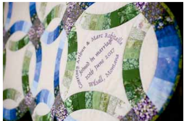
Détails de l'inscription sur la courtepointe