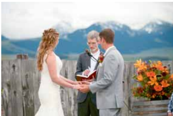
La cérémonie du mariage, les montagnes Crazy au loin

Les photographies qui suivent illustrent la beauté naturelle « parfaite » de la région et à quoi ressemble un mariage de style Montana!