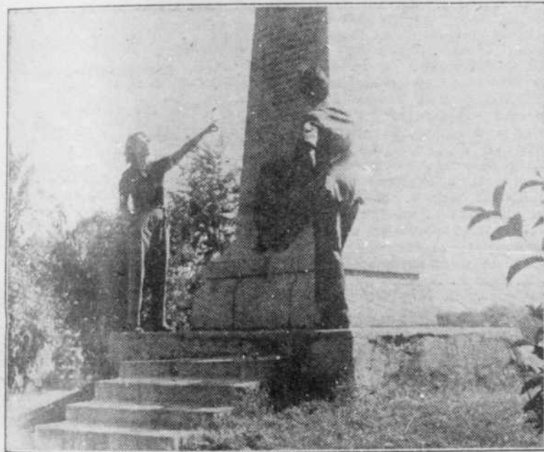
Les Laforest évoquent le passé en contemplant la liste des héros du Long-Sault, sur le monument de Dollard, à Carillon.

mieux qu'une petite excursion dans nos parages. Ça va? Bon! En voiture, donc!