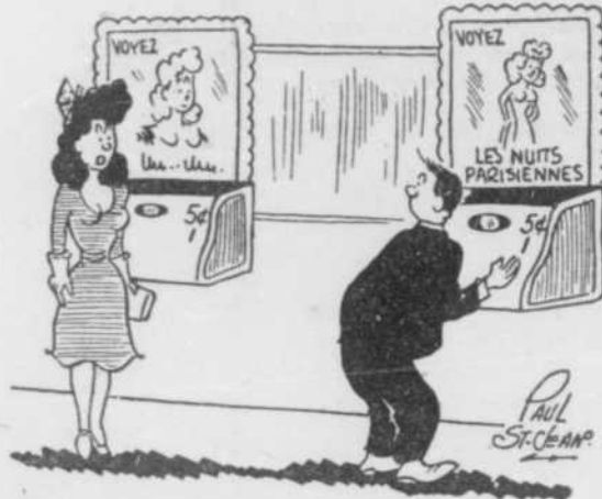
"VIENS-T-EN, JE VOUDRAIS ÉCOUTER 'POINT DE VUE' AVEC 'FERDINAND BIONDI' A 10.55 P.M.!"

Bonjour et le meilleur souvenir de tous tes amis de Montréal. Lord Oh! Oh!