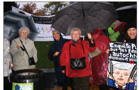
Place Émilie-Gamelin - 10 octobre 2014

collaboration avec l'association Femmes autochtones du Québec. Un kit de mobilisation a été préparé à l'intention des organisations régionales et locales afin que soient multipliées ces vigiles solidaires. En fait, 126 vigiles ont été organisées et vécues au pays.