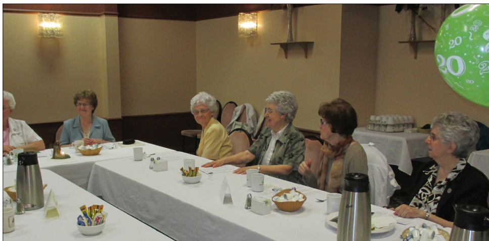
Saguenay, 6 juin 2014

Anciennes et membres actuelles ont souligné avec émotion les cinq compagnes décédées en cours de route. Les invitées se sont exprimées sur ce qu'elles renaient de leur implication à l'ARDF: un lieu de libre parole, d'évolution dans la cause des femmes, de créativité, de solidarité avec d'autres réseaux de femmes, de conscientisation des oppressions, de croissance comme femme et comme femme religieuse féministe! Un survol de l'histoire de l'Association a été réalisé avec les 3 chroniques de Reli-Femmes 2013-2014 concernant la région et avec des photos rappelant de beaux souvenirs! Fierté et joie partagées dans ces retrouvailles en toute simplicité. Voilà pour le passé et voici le projet pour la présente année. Avec le souci de continuer une certaine présence dans les milieux sociaux touchant les femmes tout en respectant les forces et les limites de chacune, chaque membre de