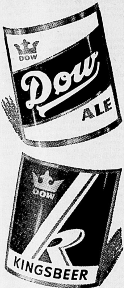
DOW... KINGSBEER... Deux bières de bon goût pour les Canadiens, à l'année longue.