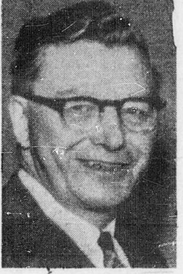
HUGH JOHN FLEMMING... ministre des Forêts