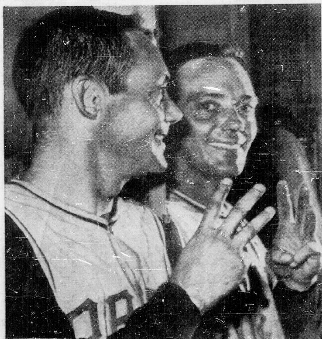
LE HEROS DES PIRATES — Le petit lanceur de relève Elroy Face indique le chiffre trois à l'aide de ses doigts pour démontrer qu'il a été fructueux à trois reprises contre les Yankees de New York dans la présente série mondiale. Les Pirates de Pittsburgh, champions de la Ligue nationale, possèdent une avance de 3-2 et la sixième joute de la série a lieu aujourd'hui au Forbes Field, de Pittsburgh. Face a aidé Vernon Law à deux reprises et le gaucher Harvey Haddix, lundi, quand les Pirates ont pris les devants en gagnant 5-2. Face sera prêt à participer à la joute d'aujourd'hui si le besoin s'en fait sentir. Le droitier Bob Turley, qui a été défait durant la deuxième joute, est le choix de Murtough pour affronter les Yankees, pendant que Casey Stengel n'a pas encore dévoilé le nom de son lanceur débutant. L'on croit cependant que le gérant des Yankees se servira du droitier Bob Turley pour tenter d'éviter l'élimination.