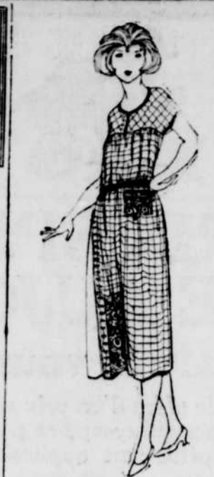
Lorsque le gingham est sorti de la cuisine pour être porté au dehors, bien des femmes protestent; mais cette mode de porter la batiste ou l'indienne, comme robe de promenade, l'été, est venue de la guerre, alors qu'il s'agissait d'économiser. Cette mode persiste encore et l'on en fait de jolies robes du matin, comme celle-ci.

refaire ma vie avec vous, je crois aussi que je suis incapable de le refaire avec un autre. Brusquement des souvenirs qu'on croyait effacés renaissent et l'on sent peser sur soi toute la force du passé. Adieu, monsieur... (à part, dans l'escalier) Ma famille ne comprendra jamais pourquoi j'ai été odieuse avec ce pauvre garçon! j'ai dû lui offrir pourtant d'échapper à la tentation... C'est fait!