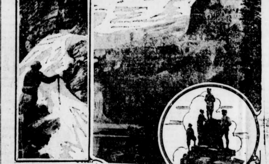
L'ascension du mont Assiniboine

Le Club Alpin du Canada, qui s'est établi provisoirement dans la région du mont Assiniboine, près de Banff, Alberta, réunira cette année ses membres au lac O'Hara, situé dans la fameuse région montagneuse qui s'étend au sud de la voie du Pacifique Canadien, entre le lac Louise et Field. Par sa situation pittoresque au sein de majestueuses montagnes aux cimes neigeuses, avec son eau limpide et couleur d'émeraude, qui réfléchit comme un véritable miroir, les plus enviro-nnants, ce lac est l'un des plus beaux et des mieux choisis pour être le rendez-vous des alpinistes canadiens, qui en cours de leurs nombreuses randonnées dans les Rocheuses, ont déjà été en mesure d'admirer les plus magnifiques panoramas que cette chaîne offre aux yeux des touristes. Le Club Alpin du Canada, dont la