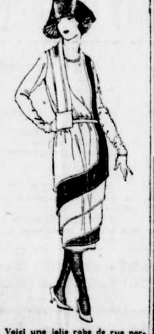
Voici une jolie robe de rue portant échappe sur le côté, terminée par une petite poche pour mettre le mouchoir et pouvant se relever pour entourer le cou et remplacer la fourrure, trop chaude, pour l'été. Le modèle est en deux couleurs formant une spirale de bleu