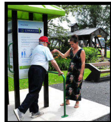
Les stations d'exercice sont adaptées aux besoins des aînés.

Pour concrétiser le projet, la Municipalité de Joly a profité d'une subvention de