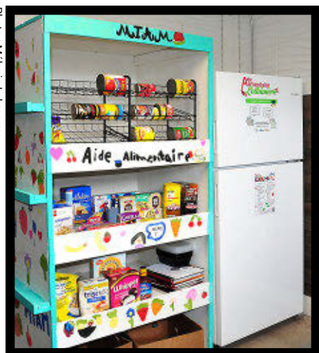
Le frigo communautaire de Joly est à l'intérieur.

Aide Alimentaire Lotbinière (AAL) a procédé, le 12 juillet, à l'inauguration du sixième frigo communautaire du territoire. Il se trouve à Joly, dans le chalet des loisirs.