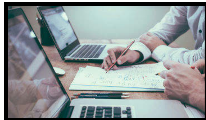
Le mois de l'entrepreneuriat met en valeur les initiatives d'affaires locales.

ternables du S.A.E. seront présentés. Les partenaires ont fait le point sur les activités déjà organisées comme le Gala entreprises, le 7 novembre, ainsi que le Souper Goûtez Lotbinière, le 19 novembre.