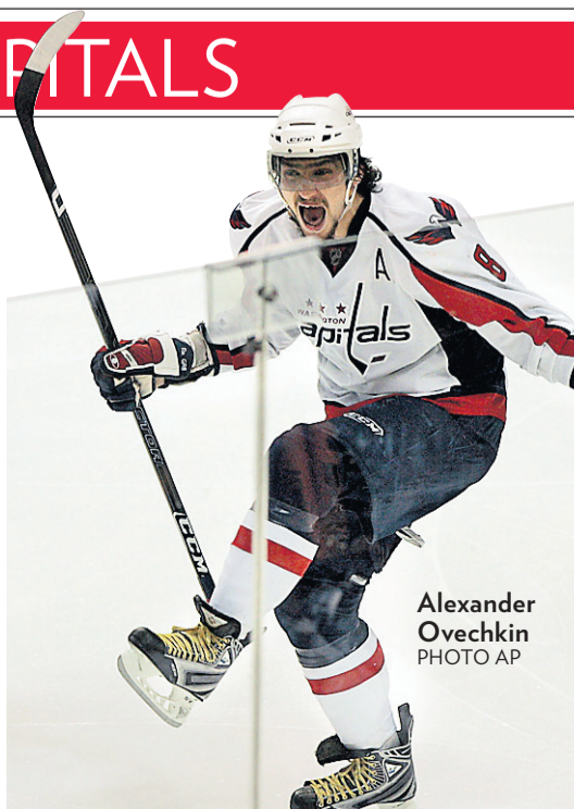
Alexander Ovechkin

→ L'attaque à cinq des Capitals a marqué 11 buts en 32 occasions (34,4%) à ses huit derniers matchs. Inversement, celle du Canadien s'est contentée de quatre buts en 37 occasions (10,8%) à ses huit dernières parties.