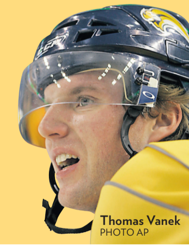
Thomas Vanek

SUR CYBERPRESSE.CA LES SABRES SERONT EN VILLE demain soir pour y affronter le Canadien. Mais Thomas Vanek sera-t-il du voyage? Meilleur marqueur de la Ligue nationale avec 15 buts, l'ailier a mal encaissé une mise en échec de Milan Lucic, mercredi soir, et sa présence à Montréal est incertaine. Pour connaître d'heure en heure son état de santé et celui des autres vedettes de la LNH, rendez-vous à cyberpresse.ca/lnh