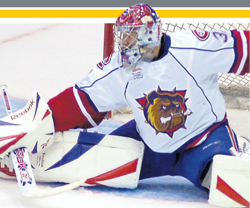
Cedrick Desjardins PHOTO PC