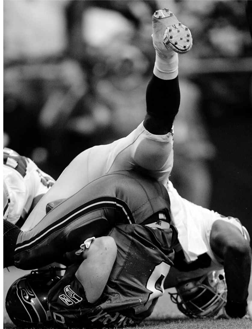
Le secondaire DeMarcus Ware a écrasé le quart-arrière Matt Hasselbeck, des Seahawks, au troisième quart, mais il a dû quitter le match peu après. Premier diagnostic : entorse au genou gauche.

« Je vais bien, a dit Young en s'éloignant des journalistes après le match. J'en parlerai lundi. »