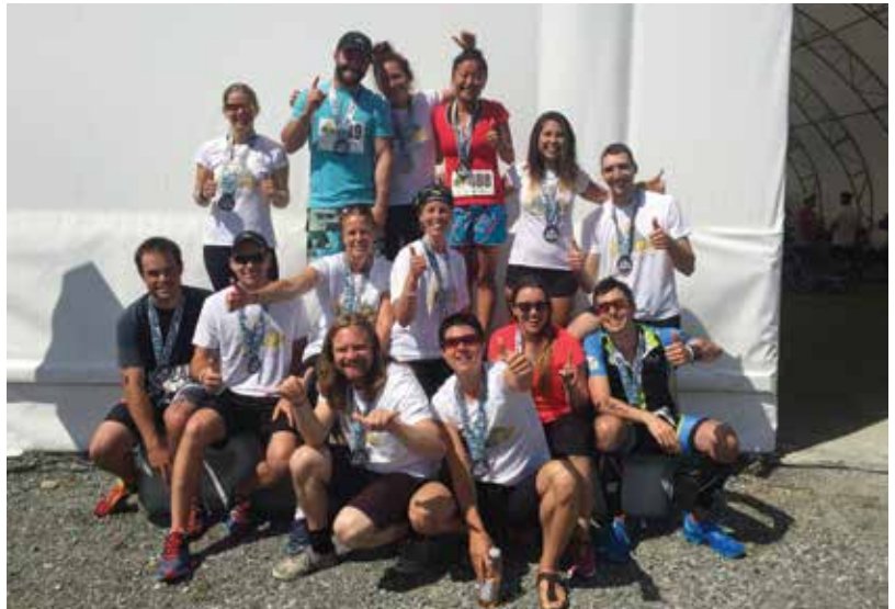
Des participants au Triathlon Agnico Eagle, le 1 er août 2015.

Tout d'abord, le contenu des machines distributrices de la mine sera revu afin d'offrir des choix plus équilibrés pour les employés. Également, à la suite d'un sondage, Janie Blanchette a découvert que les employés désiraient apprendre comment lire des fiches nutritives. Des capsules