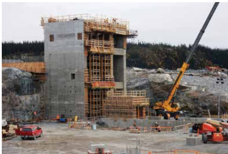
Concasseur en construction

Malgré cette proactivité, le travail ne fait que commencer. Formé en santé et sécurité dès son arrivée, le travailleur est appelé à adopter des comportements sécuritaires sur