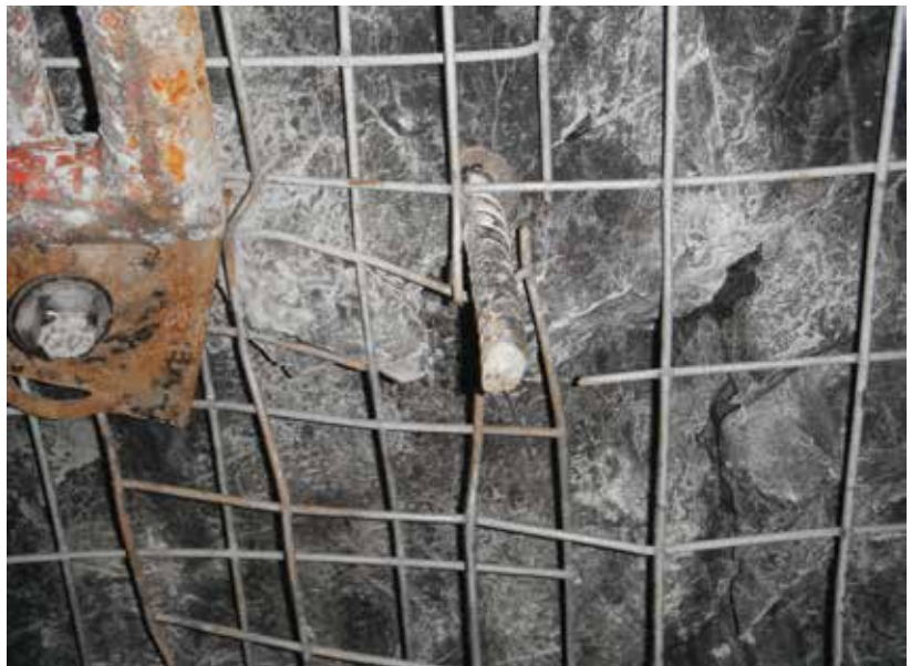
Pré-support installé dans la volée avant

Pour éviter que ce type d'incident se reproduise, des mesures ont été mises en place, notamment la modification du devis de soutènement et l'installation de pré-support. Depuis l'incident, le devis de support a été revu et amélioré dans tous les montages de la mine. La longueur des volées a été réduite de 2,4 mètres à 1,8 mètre. Pour le support, des