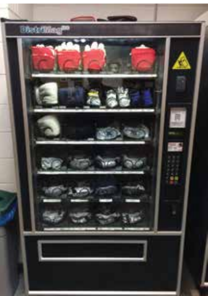
Machine distributrice à la mine Canadian Malartic