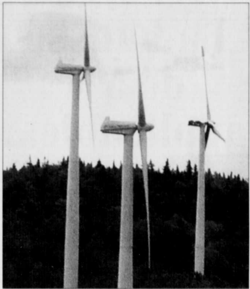
Les flammes ont détruit l'équipement mécanique et électrique situé dans la nacelle de l'éolienne, à droite de la photo.