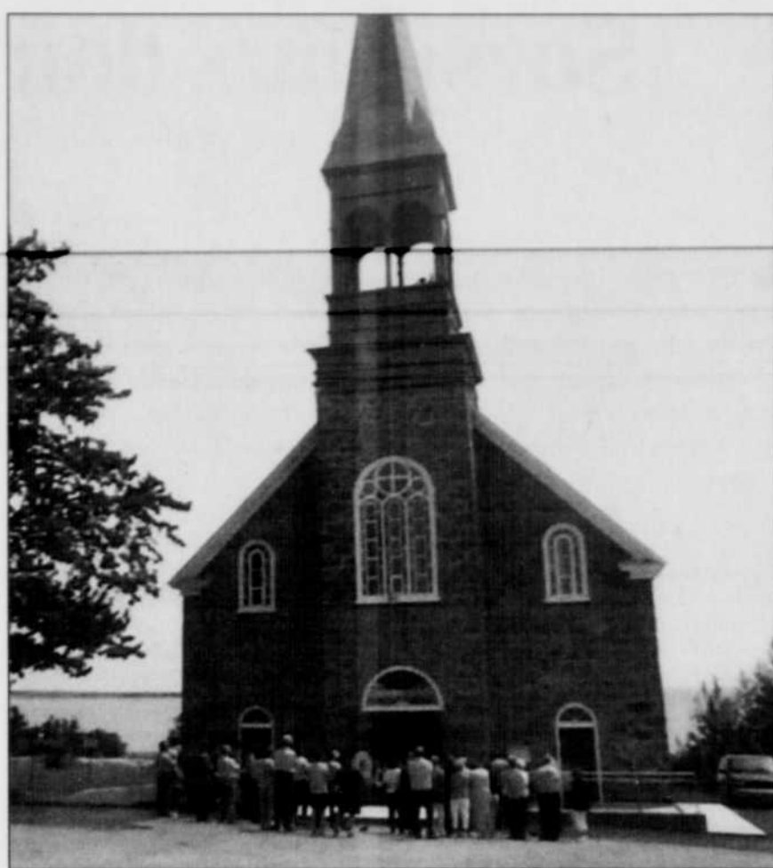
Amorcée en 1899, la construction de l'église Saint-Paul se terminera en 1901.

L'église Saint-Paul est la sixième de la Côte-Nord à franchir le cap des 100 ans, mise à part la chapelle de Tadoussac qui a près de quatre siècles. L'église Saint-Paul dessert une population de 600 âmes, soit la moitié du nombre d'habitants de Longue-Rive.