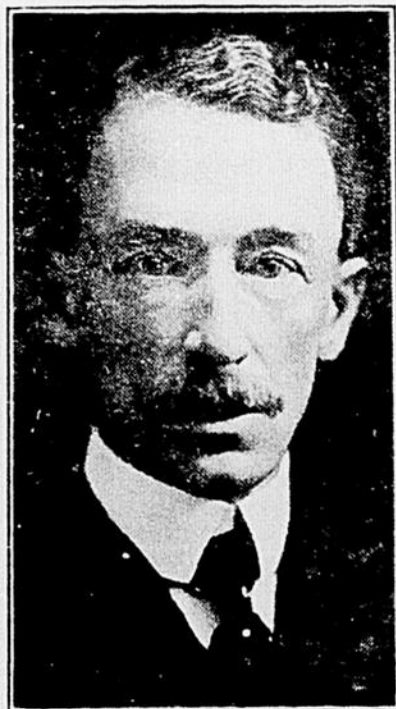
L'Hon. ALEX. TASCHEREAU premier ministre du Québec, va-t-il déclancher une élection cette année ?

— Ah! le lâche!... Le matin, sa femme, tôt levée, retourne son mari près de l'aroulotte. — Ou as-tu passé la nuit? — Ma chérie, explique le dompteur, j'ai pensé, à mon retour, que tu dormais, que j'allais te réveiller et, pour ne pas te déranger, je suis allé m'installer dans la cage de Brutus.