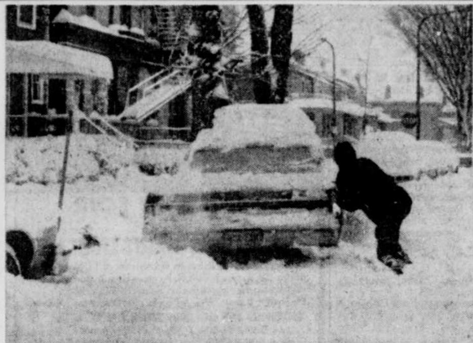
Un beau matin blanc...