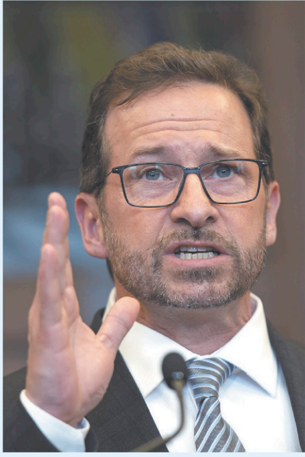
Yves-François Blanchet