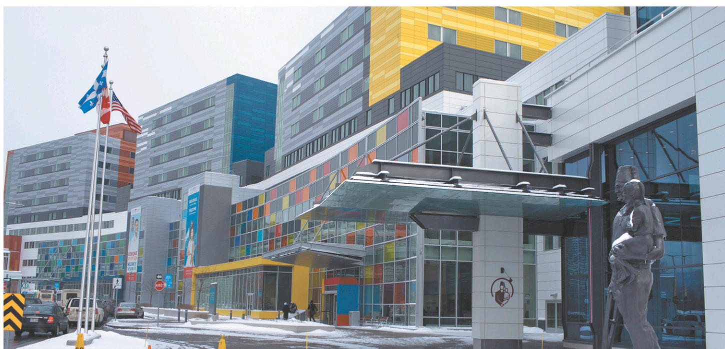
La direction du CUSM estime que les risques de contagion sont très faibles.

Le CCU a toutefois recommandé d'« amorcer une réflexion quant à la stratégie de commémoration de la maison Redpath à prévoir dans les plans ».