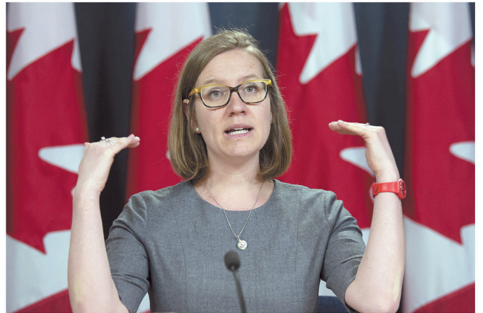
Karina Gould, ministre des Institutions démocratiques