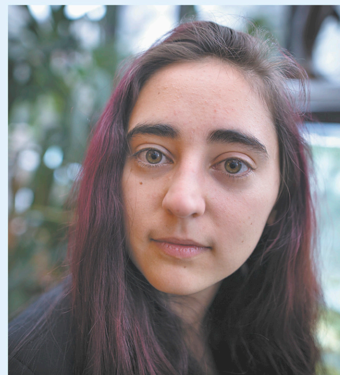
« Où se trouvent tous ces violeurs ? » interroge la juriste Suzanne Zaccour dans un essai. JACQUES NADEAU LE DEVOIR