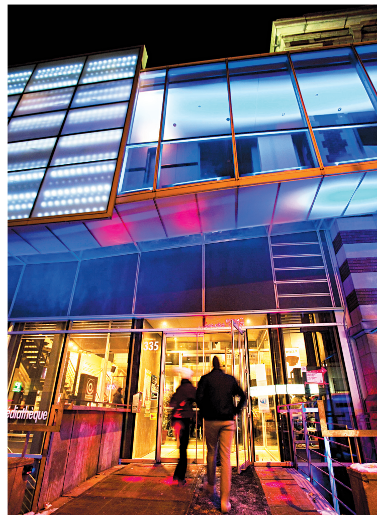
MARTINE DOYON PARTENARIAT DU QUARTIER DES SPECTACLES La Cinémathèque conserve des milliers de films d'animation.

Aujourd'hui encore, Montréal reste une place forte du cinéma d'animation. Il est très courant, dans les festivals à l'étranger, qu'une bonne partie de la sélection provienne des studios québécois, et ce sera encore le cas dans quelques semaines à Annecy, en France, site du plus grand festival d'animation au monde. « Depuis l'explosion des technologies — numérique, nouveaux médias, effets spéciaux, etc. — le Québec et le Canada restent à l'avant-garde, affirme M. de Blois. Ce qui est intéressant, c'est que les techniques traditionnelles et modernes cohabitent très bien. De par mon poste, mon