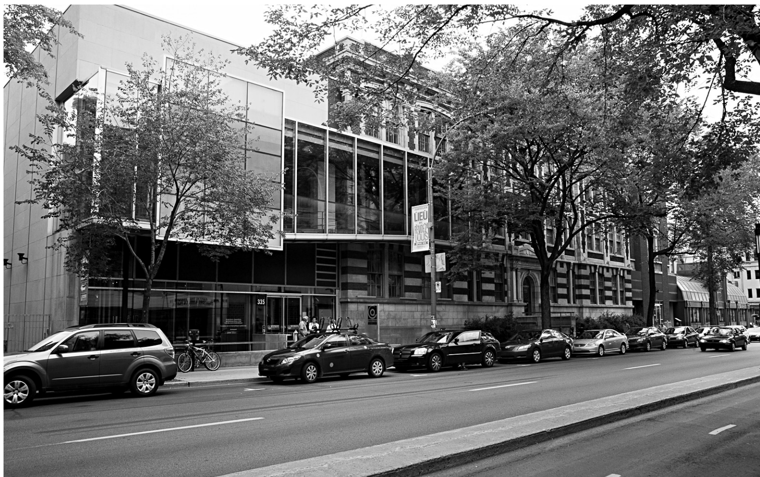
FRANÇOIS PESANT LE DEVOIR

La Cinémathèque québécoise célèbre cette année ses noces d'or.