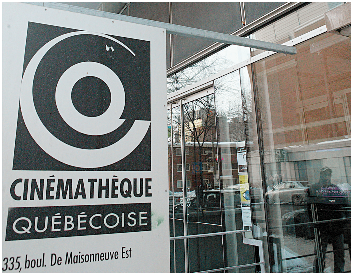
La Cinémathèque québécoise a été fondée en 1963.

Cette noble tâche constitue un défi permanent pour un organisme auquel on a confié en 2006 le mandat de conservation et de gestion du dépôt légal des films québécois, sans compter que tout ce cinéma ne se décline plus sur pellicule, mais sur divers formats numériques, ce qui représente un grand défi de préservation et de diffusion. Tout cela retombe sur les épaules d'un organisme à but non lucratif dont le sous-financement chronique est de notoriété publique. « Depuis mon arrivée au conseil d'administration, j'ai lu des dizaines d'études qui ont été faites par mes prédécesseurs ou par des firmes comptables, et elles sont