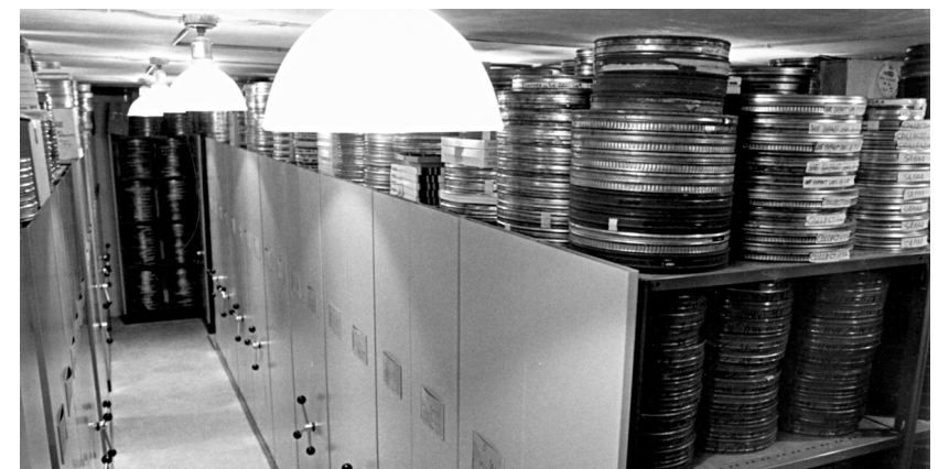
SERGE DESAULNIERS L'entrepôt de conservation de Boucherville, tel que vu en 1988

faites par le secteur privé. Nous avons ainsi des émissions de TVA, mais également de divers producteurs privés. »