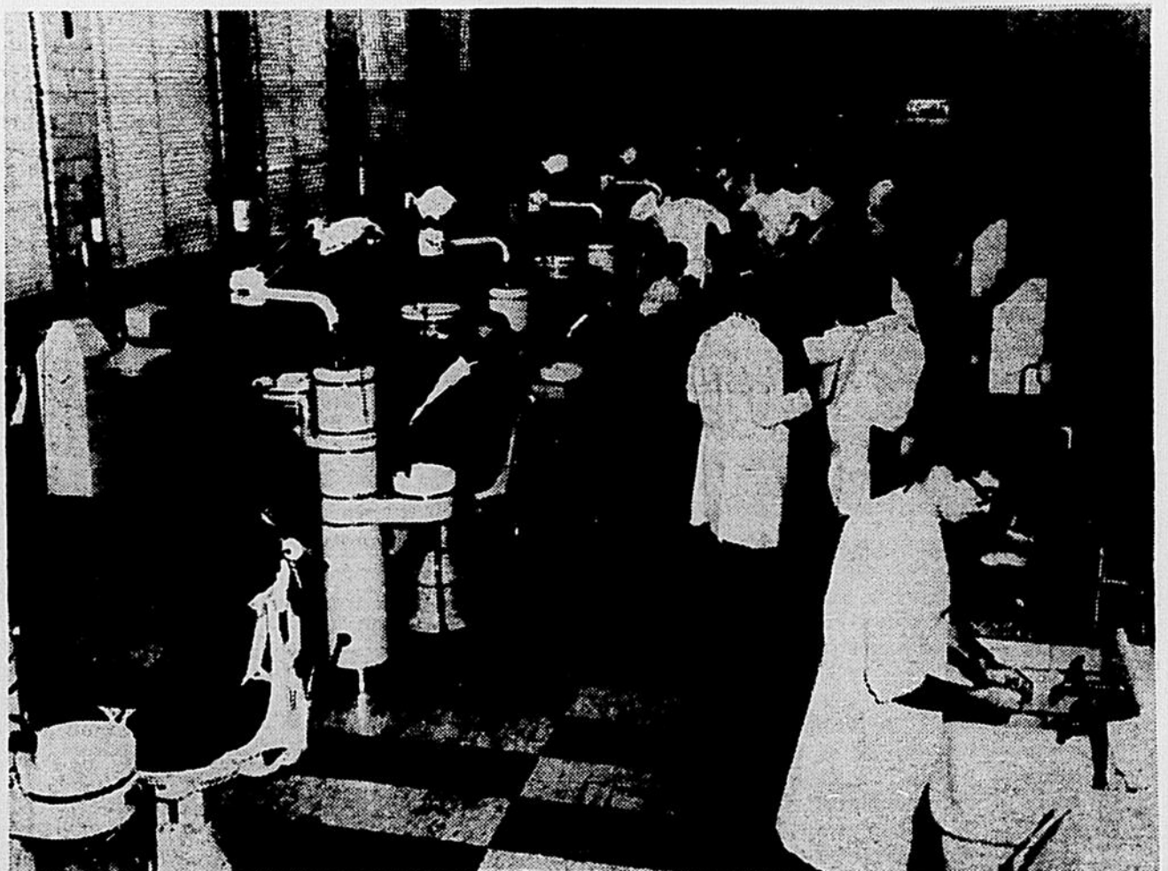
La clinique de prothèse de l'Université de Montréal