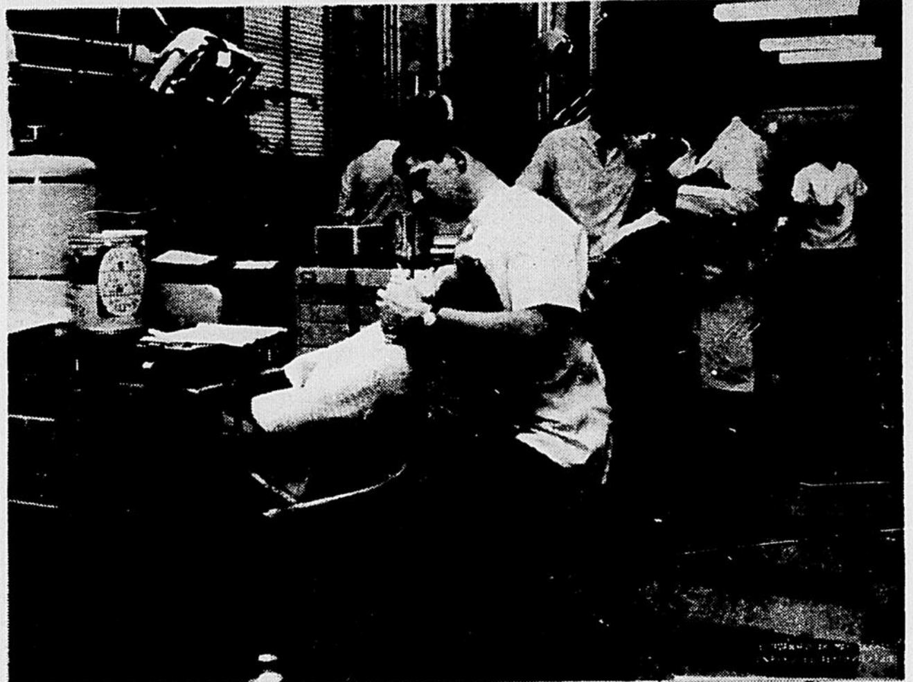
La clinique d'orthodontie, où viennent travailler des gradués du monde entier...