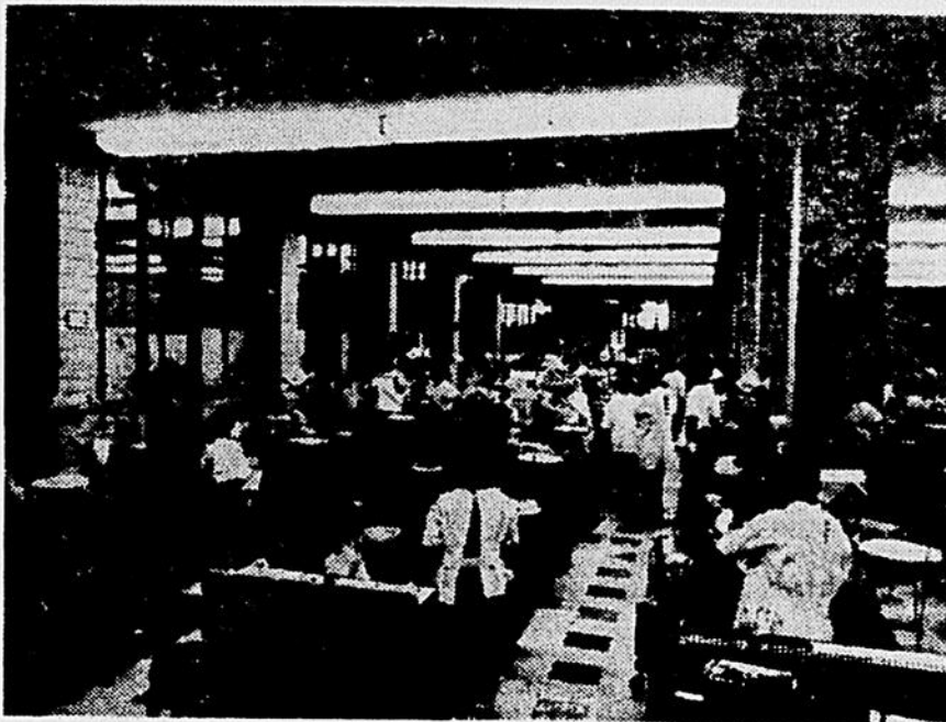
"Longtemps la chirurgie dentaire a été exercée par le sexe fort..."