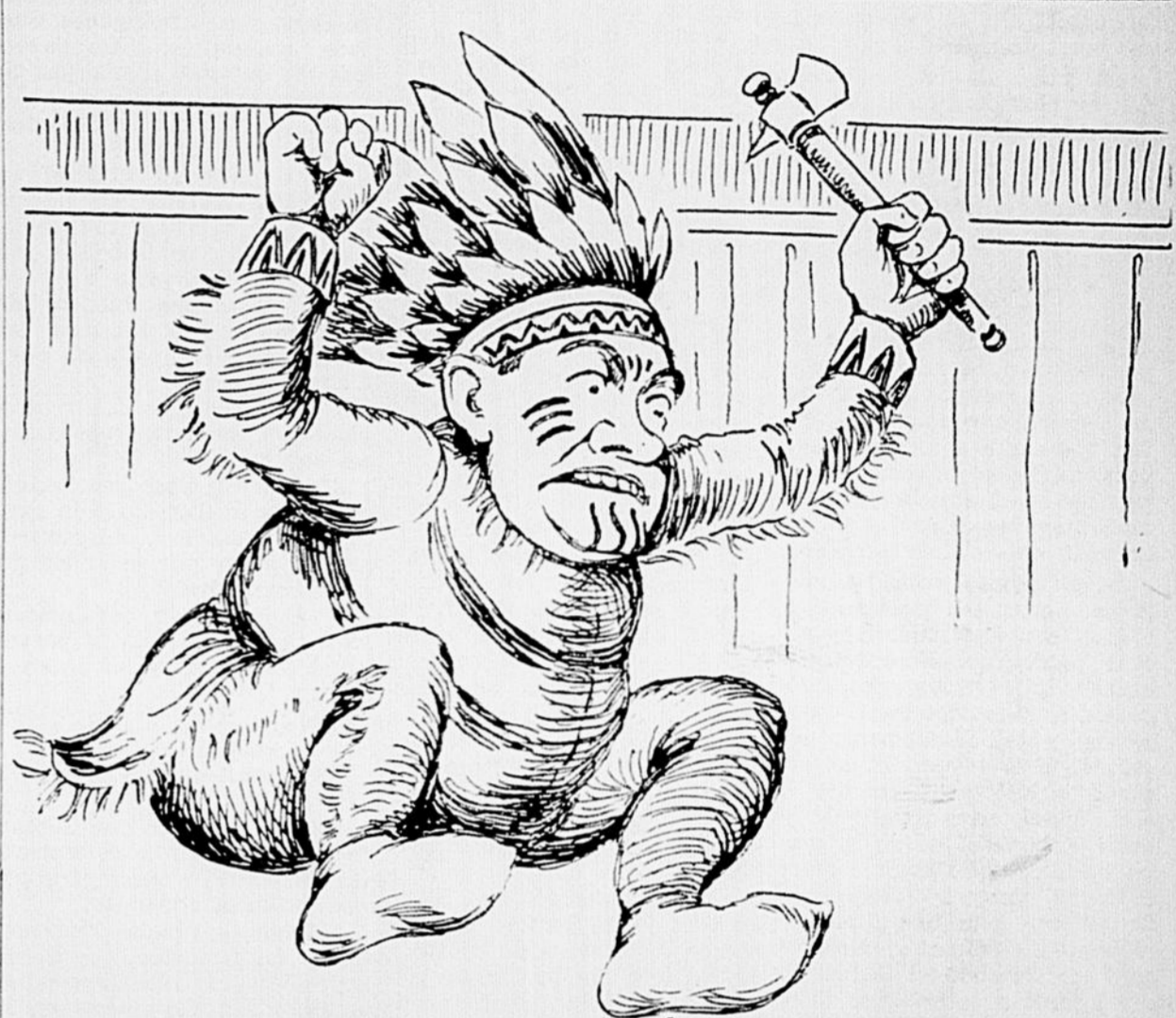
CAMILLIEN LE HOUDISTE: — Puisqu'il y a de la bataille dans St-Henri, je me demande pourquoi je ne serais pas là.