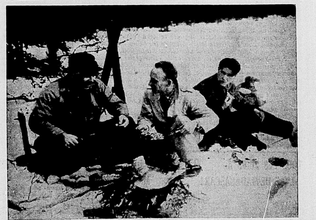
Le lunch, pris au coin d'un bois, reste l'un des meilleurs souvenirs d'une excursion de "cross-country".