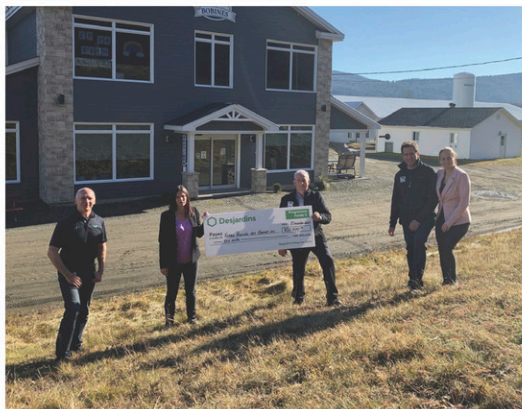
Un appui financier pour la croissance de la Ferme piscicole des Bobines en provenance du Fonds C Desjardins.