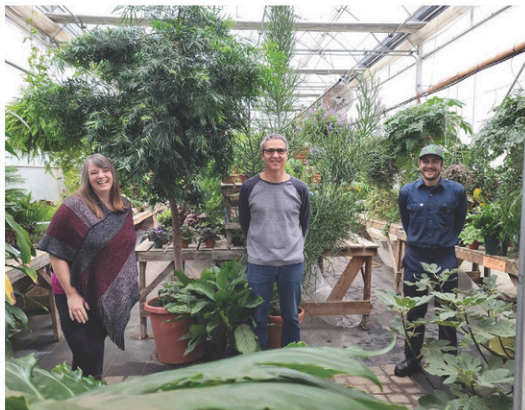
Un coup de pouce financier pour les élèves du Centre de formation professionnelle de Coaticook.