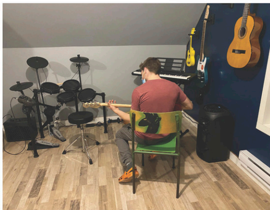
Un projet musical pour la Maison des jeunes de Waterville Les Pacifistes : des instruments et des cours pour nos jeunes.