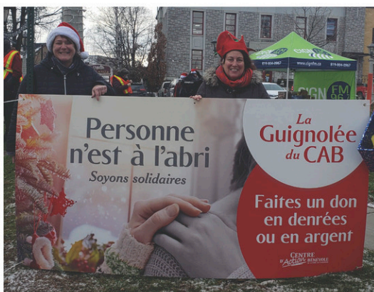
Des denrées, des dons en argent et de beaux paniers de Noël remplis d'amour et de solidarité pour les gens de notre communauté.