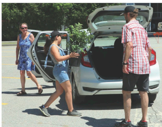
Des arbres pour les résidents de la municipalité de Compton dans le cadre de la Journée de l'arbre.