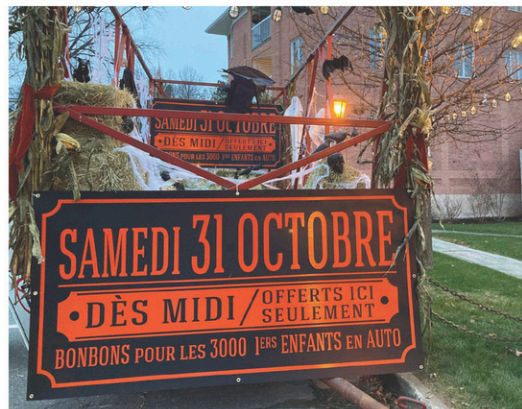
Une fête de l'Halloween à l'auto, organisée par Rues Principales, et des gâteries pour 3 000 enfants.