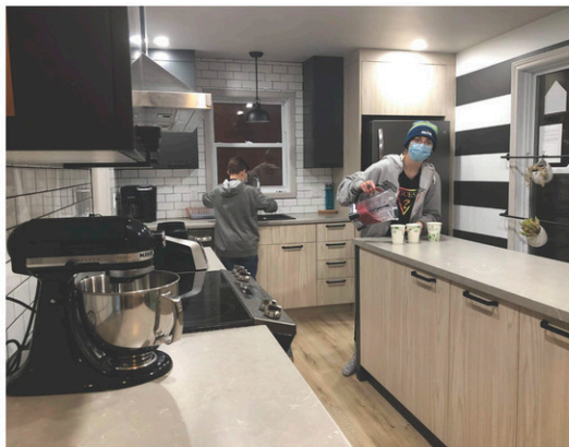
Une nouvelle cuisine et une zone zen pour les jeunes de la Maison des jeunes de Coaticook.