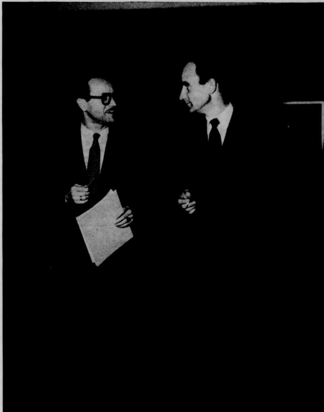
Le réalisateur et l'animateur des "Idées en Marche"

Pendant les sessions, la tâche des correspondants